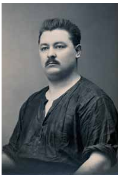
Jan Harus patřil k nejsvráznějším postavám československého komunistického hnutí

Václav Bolen, další čelný představitel starého vedení KSČ, vůči Gottwaldově frakci na sjezdu vystupoval ostřeji. Organizování stávků v severních Čechách nesmlouvavě kritizoval, masy se prý do ní zapojit nechtěly. Bolen se opakovaně odvolával na sovětské představitelky a při projevu byl přerušován nesouhlasnými výkřiky delegátů. Gottwaldově skupině nakonec otevřeně řekl: Pracujete tak, že tím vedete stranu přímo do zkázy. 15 Po skončení projevu byl Bolen kritizován některými delegáty i Gottwaldem. Ten ho označil za likvidátora, 16 což je výraz, kterým pak byli odpůrci nového vedení KSČ nálepkováni nejčastěji. Bolen se znovu ujal slova