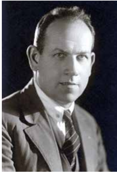
Antonín Zápotocký jako mladý poslanec KSČ

Od května do října 1929 byl důležitou hlásnou tribunou komunistické opozice týdeník Komunista . Brojil proti Gottwaldovu vedení KSČ a jeho ultralevému kurzu. Jednotlivá jeho čísla mimo jiné přibližovala, jak členové strany z různých regionů vystupují proti Polbyru. Informovala o organizační výstavbě komunistické opozice v jednotlivých oblastech, nejčastěji na Kladensku, v Pražském kraji, v Plzni, Pardubicích, Českých Budějovicích, Německém Brodě, na Prostějovsku, Ostravsku, ale i v německých oblastech republiky, na Slovensku a jinde. Komunista dokládá, jak se opozice organizačně formovala na místní, okresní i krajské úrovni. V druhém čísle listu z 9. května se objevil Jílkův příspěvek. Autor v něm vysvětloval, proč se nepodřídil Kominterně. Usnesení prezidia exekutivy Komunistické internacionály podle něj nebyla správná. Tvrdil, že leninismus nezná slepé disciplíny, není možné se jim automaticky podřizovat. Jílek upozorňoval na rozpor, kdy Kominternu plně schválila usnesení čtvrtého sjezdu