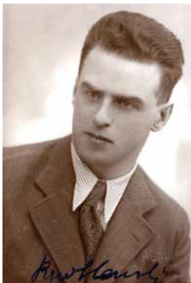
Rudolf Slánský za první republiky

Ve volbách do Poslanecké sněmovny konaných 27. října 1929 získala KSČ 30 mandátů z celkových 300. 50 Oproti posledním volbám v roce 1925 ztratila 11 poslaneckých křesel. 51 Někteří historici psali o relativním úspěchu KSČ, navzdory velké krizi v době pátého sjezdu dosáhla solidního výsledku. 52 Je však třeba upozornit na to, že k tomu výrazně přispěl postup komunistické opozice, která ve volbách nekandidovala. Komunista z 2. října doporučoval, aby stoupenci opozice volili KSČ. Uvedl, že to není projev důvěry vedení KSČ, opozice ve volbách nekandiduje v zájmu jednoty třídního dělnického hnutí. Opoziční činitelé měli dle Komunisty dále usilovat o vnitrostranickou demokracii a nový sjezd KSČ. 53 Je otázka, jaké pohyby vedly komunistickou opozici k tomuto postupu, možná se snažila udělat dojem na Kominternu, aby jí vzala opět v úvahu. Pokud jednala nesobecky v zájmu komunistického hnutí, je poněkud úsměvné, že