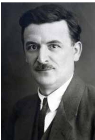
Václav Bolen, jeden z představitelů KSČ ve dvacátých letech, se angažoval v komunistické opozici

Prohlášení podepsala menší část z 61 poslanců a senátorů zvolených do Národního shromáždění v posledních volbách, 30 i tak se ale jednalo o významnou skupinu. Kladenský list Svoboda , který se v březnu a dubnu po 14 dnů nacházel v rukou odpůrců Gottwaldova vedení, prohlášení otiskl ve vydání z 29. března 1929. O dva dny později ho publikovalo dokonce i Rudé právo , 31 byť se k němu KSČ stavěla odmítavě. Proti vystoupení 26 poslanců a senátorů a pro linii pátého sjezdu se vyslovili starší vůdci KSČ Bohumír Šmeral a Karel Kreibich, v prohlášení spatřovali těžké poškození strany. 32 V příštích týdnech někteří zákonodárci podpis na prohlášení tzv. šestadvacitky odvolali, Reiman ve vzpomínkách zmiňuje Vojtěcha Hampla, Tomáše Koutného, Aloise Včelíčku a Františka Chlouby. 33 Ve vydání periodika