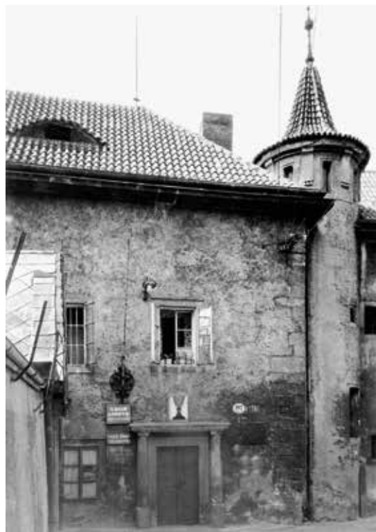
Vlevo pohled na Templ z Ptáček (tehdy Marxovy) ulice v roce 1971. Budova stále stojí, ale jsou na ní patrná dvě desetiletí neúdržby a chátrání. Vpravo vstup do objektu Templu od mladoboleslavského náměstí v roce 1956, kdy zde stále ještě sídlila církev. Je zřejmé, že už tehdy nebyla památka v dobrém stavu.

KNV ji odmítl s tím, že prostředky byly určeny výhradně na rok 1955 a pokračování oprav v dalším roce je možné financovat pouze z plánu oprav na rok 1956. Ten však byl už v té době dávno stanoven, schválen a uzavřen a povolený limit na přesun prostředků do dalšího roku byl vyčerpán. Z plánované opravy tedy sešlo.