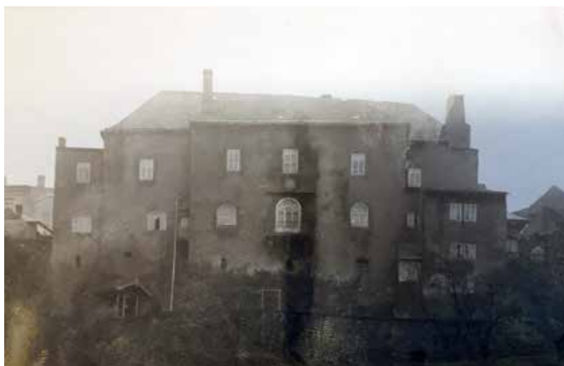
Budova Templu, jak vypadala ve 20.-30. (?) letech 20. století, kdy ji vlastnila Církev československá (husitská) - nečleněná klasicistní fasáda s okny v líci, nízká polovalbová střecha a soustava přístavků po stranách hlavní budovy