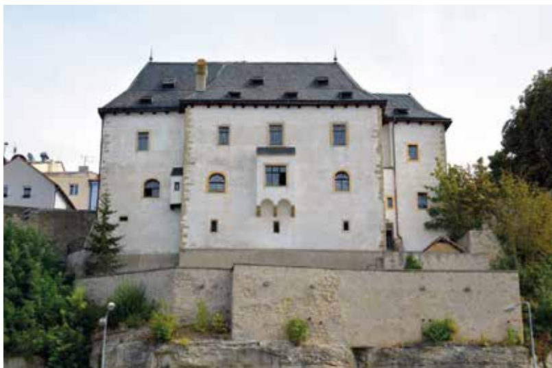
Dům čp. 102 v Mladé Boleslavi, zvaný Templ, současný stav při pohledu z dnešní Ptáček ulice. Templ stojí na západní hraně ostrohu tvořícího historické centrum města a vedle mladoboleslavského hradu tak tvoří významnou dominantu při pohledu z údolí Jizery.

Zástupci náboženské obce se rozhodli pro nejnutnější opatření: výměnu dozívající střechy a oken. Obratem objednali truhláře, klempíře a pokrývače. Stojí přitom za zmínku, že pokrývačské práce měla ještě