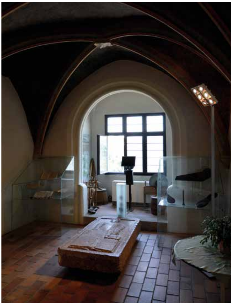
Obnovená gotická síň – současná podoba s muzejní expozicí z roku 2000

Toto nepřehledné a nepředvídatelné prostředí mělo ještě jednu vlast-