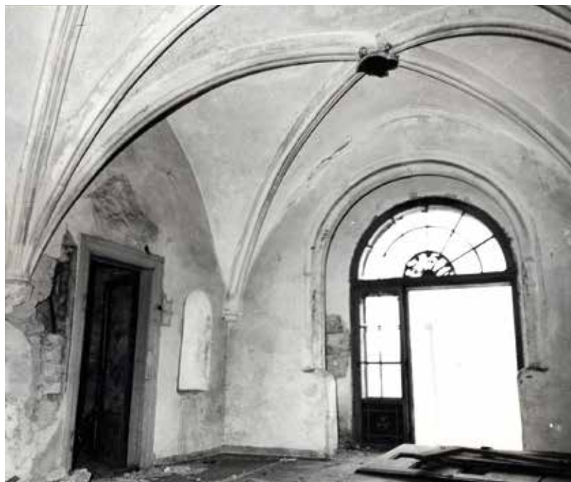
Nejcennějším prostorem středověké památky je ústřední žebry klenutá gotická síň. Takto vypadala na začátku 70. let, když byl Templ už několik let opuštěn.

později byl vystěhován a pravidelně se o něm psalo jako o památce na hraně zániku. Může se proto zdát překvapivé, že na začátku 70. let budova pořád stála. Pro Templ tento zdánlivý rozpor – historické domy často vydrží mnohem víc, než se očekává – přestal platit v březnu 1974. Tehdy se část objektu náhle zřítla.