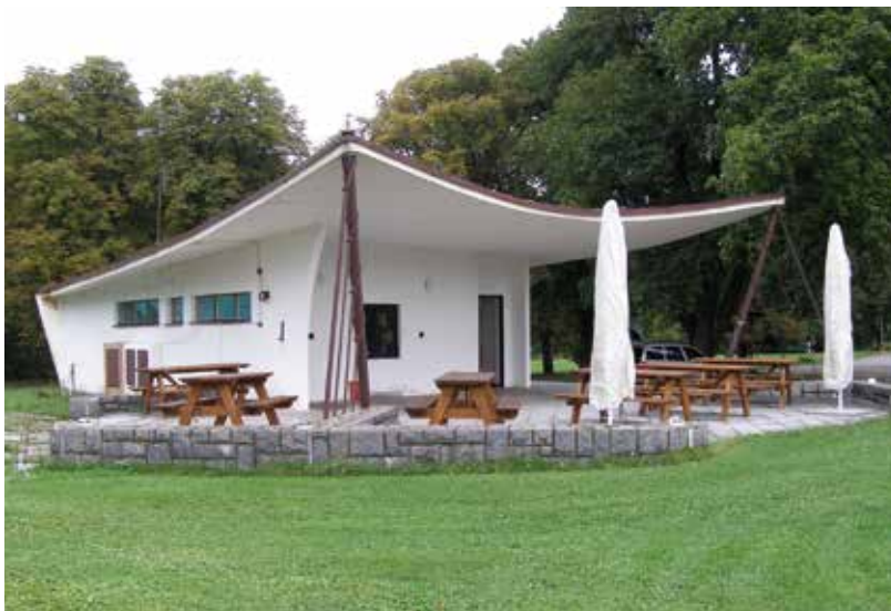
Štrougalova vila a sportovní klubovna se skořepinovou konstrukcí ve Vystrkově