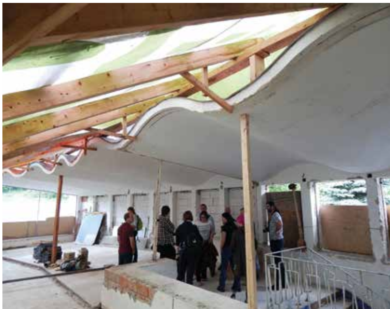
Současný stav prezidentské vily a bazénu ve Vystrkově a detail ojedinělé zvlněné konstrukce na terase

podařilo náhodně objevit v centrální spisovně v Příbrami, nenajdeme k rezortu „Orlík“ jméno ani jednoho z architektů, kteří zde pracovali. U razítka technického ústavu nebo technického oddělení ministerstva