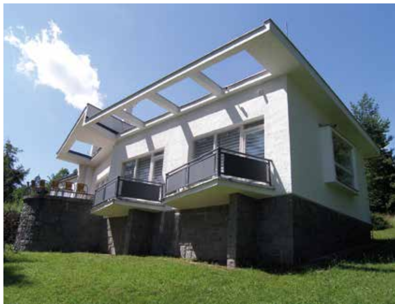
Vila číslo 11 ve Vystrkově na fotografii z roku 2011