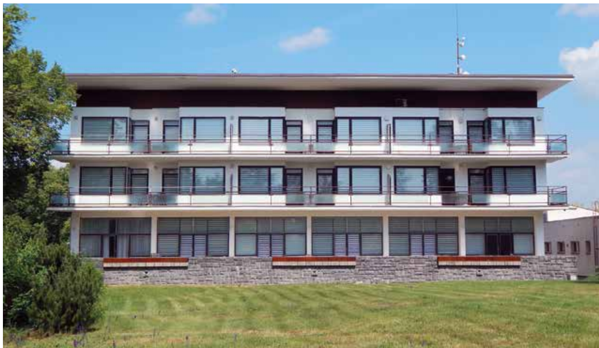
Jižní průčelí hotelu Orlík čp. 179 ve Vystřkově