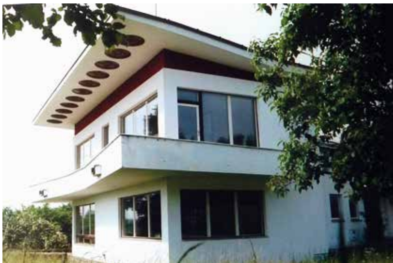
Prezidentská vila ve Vystrkově v 90. letech 20. století

Nakonec byl tedy postaven plánovaný projekt jen částečně, bez sousedního rezortu, kombinoval prvky obou etap do jednoho menšího areálu.