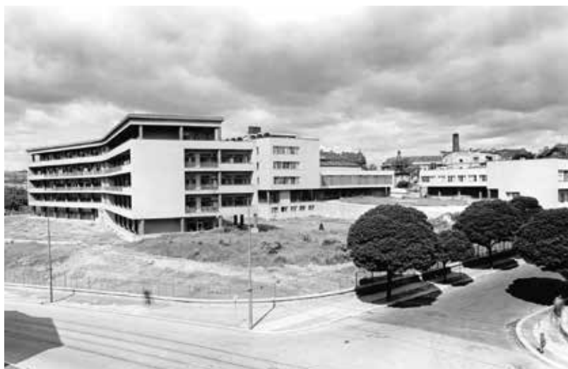
Dětská nemocnice v Brně na modelu a po dokončení v roce 1953