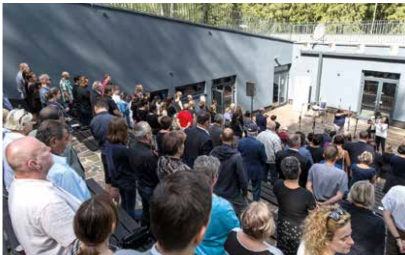
Amfiteátr památníku, pietní shromáždění

Na území současné České republiky žilo před druhou světovou válkou více než 6500 Romů nebo osob označených za Romy. Číslo to není vysoké a odpovídá počtu obyvatel měst velikosti Nové Paky, Týna nad Vltavou či Kyjova. Nacistické pronásledování přežilo kolem 10 procent z nich. Romský holokaust v protektorátu lze tedy označit za dokonale provedenou genocidu. Většinu romských přeživších žijících v současné době na území České republiky tak tvoří senioři narození na Slovensku. Jaký osud je potkal v dobách Slovenského státu? Romové nesměli žít s neromským obyvatelstvem, a byli proto vystěhováváni za obce, kde vznikaly provizorní osady, děti byly vylučovány ze škol a dospělí nasazováni na nucenou práci. Romové však nebyli deportováni do táborů na východě nebo v Polsku. Po vypuknutí Slovenského národního povstání a obsazení Slovenska nacistickou armádou