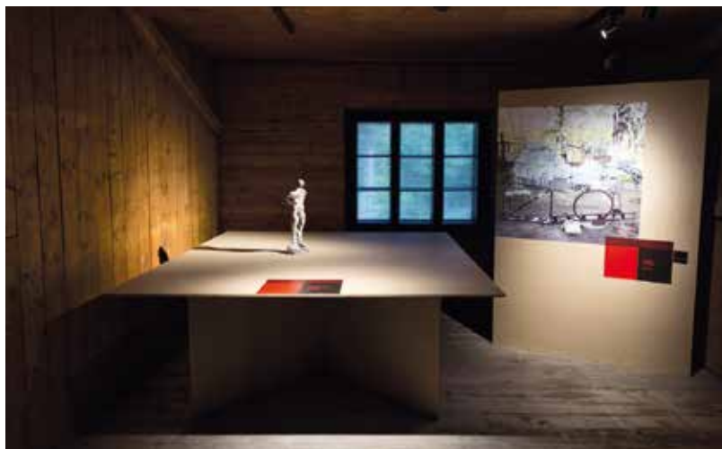
Tzv. barák dozorců, expozice vítězných příspěvků z umělecké soutěže

Přes dvě stě sloupů uspořádaných do obdélníku uvnitř areálu symbolizuje počet obětí zdejšího tábora. V jediné původní budově, baráku vězňů, nyní najdeme rekonstruovaný interiér, dřevěné palandy, informační panely a videonahrávky se vzpomínkami pamětníků. Můžeme také navštívit výstavu drobných předmětů nalezených v Letech u Písku, které patřily vězňům – jedná se o knoflíky, střípky zrcátek atd. V památníku bude otevřena také stálá expozice věnovaná romskému holokaustu.