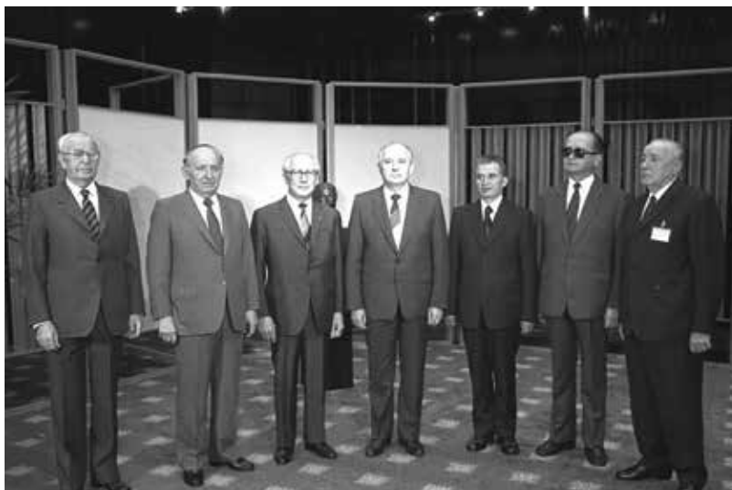
Fotografie ze sjezdu vůdců států Varšavské smlouvy v roce 1987. Zleva Gustáv Husák, Todor Živkov, Erich Honecker, Michail Sergejevič Gorbačov, Nicolae Ceaușescu, Wojciech Jaruzelski a János Kádár.

Mezi členskými státy Varšavské smlouvy rovněž panovala rámcová shoda na rozšíření agendy těchto setkání. Přesto se jejich představy o konkrétní podobě nové formy meziparlamentní spolupráce v alianci lišily. Odrážely především nekonceptnost a pokusy improvizovat v neznámé politické situaci. Tento jev byl pro spolupráci ve Varšavské smlouvě v Gorbačovové éře ostatně charakteristický. Polsko a Bulharsko navrhovaly vznik nějaké formy unie parlamentů zemí Varšavské smlouvy po vzoru Evropského parlamentu. 43 Východní Německo naopak doporučovalo vytvoření blíže nespecifikovaného orgánu pro parlamentní spolupráci v rámci Politického poradního výboru. SSSR naproti tomu avizoval, že setkání parlamentů by nemuselo