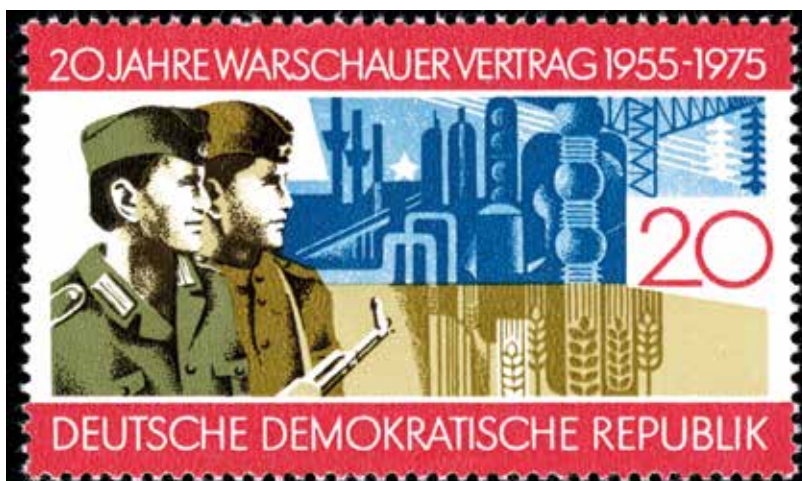
Známka vydaná k dvaceti letům Varšavské smlouvy v NDR roku 1975