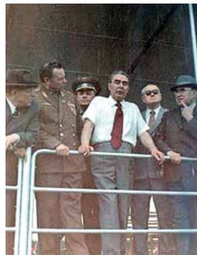
Leonid Brežněv na vojenské přehlídce