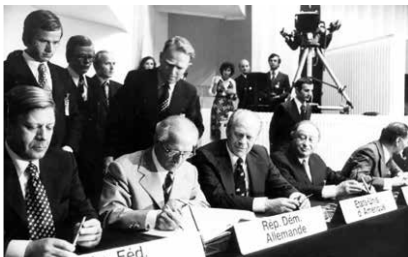
Podpis Závěrečného aktu Konference o bezpečnosti a spolupráci v Evropě. Zleva západoněmecký kancléř Helmut Schmidt, vůdce NDR Erich Honecker, prezident USA Gerald Ford, rakouský kancléř Bruno Kreisky.