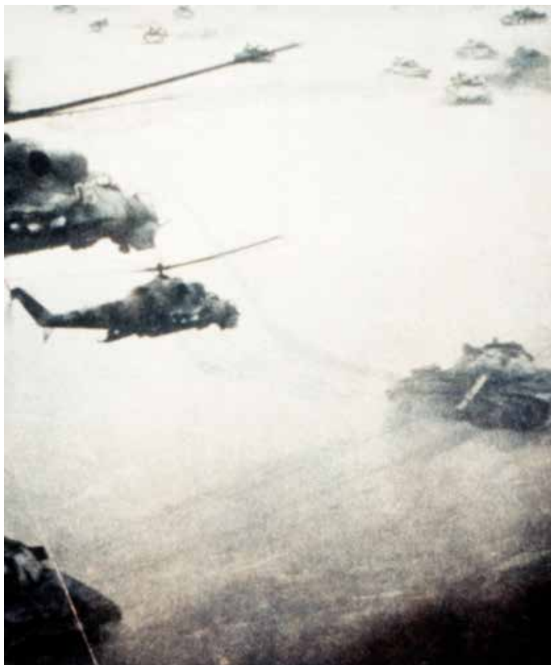
Sovětské vojenské jednotky při ofenzivě v Afghánistánu v roce 1984