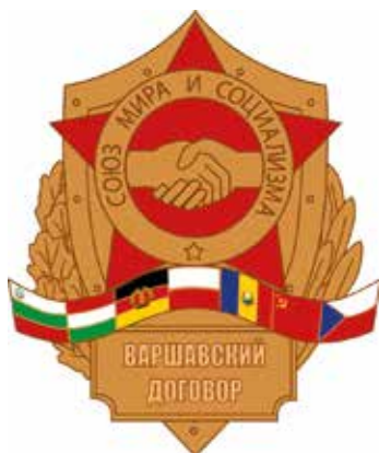
Logo Smlouvy o přátelství, spolupráci a vzájemné pomoci