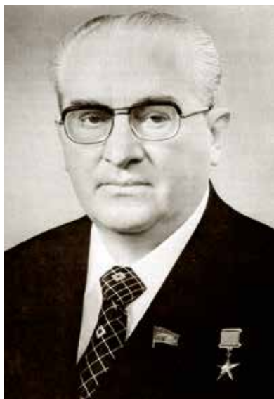
Jurij Vladimirovič Andropov v roce 1983