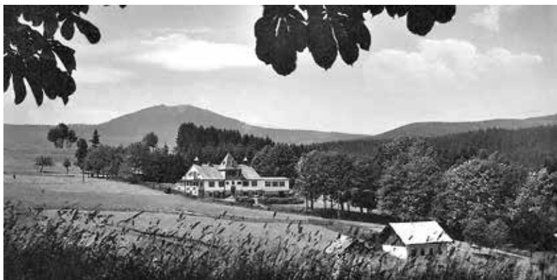
Restaurace a penzion Lomova dědečka Schluderpachera u Železné Rudy na Šumavě

Herbertův otec se zkoušel prosadit v různých oborech. Pro budoucí životní dráhu jeho syna však byly rozhodující otcovy komerční aktivity v oblasti divadelnictví. Po mnoho let zajišťoval výrobu tiskovin mapujících pražské německé divadelní prostředí. V první řadě vydával programový Theater-Zeitung . Rodina díky tomu měla stálou ložnici v Novém německém divadle na pražských Vinohradech (dnes budova Státní opery Praha), které bylo kulturním centrem německy hovořících Pražanů té doby.