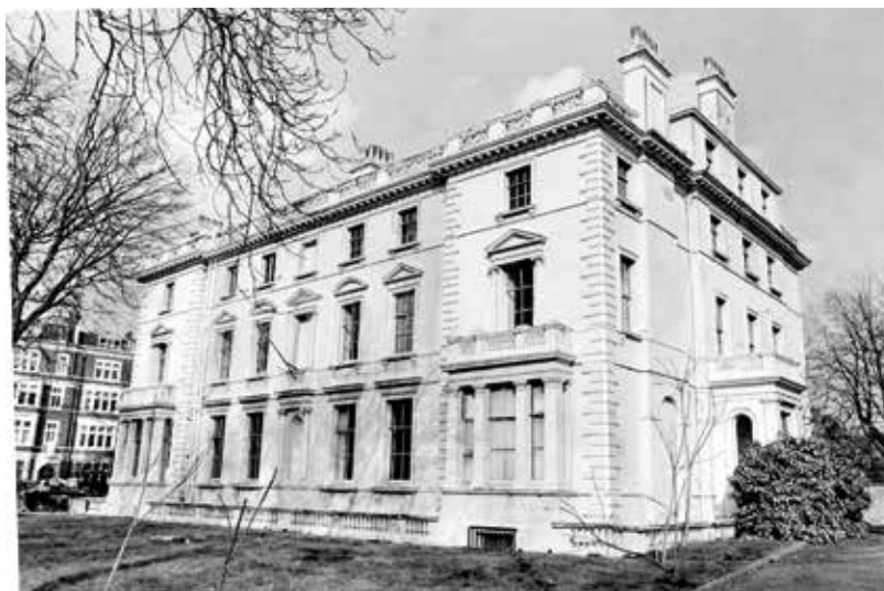
Reprezentativní budova na prestižní londýnské adrese Kensington Palace Gardens, č. 6-7. Od roku 1955 zde až do konce šedesátých let sídlil československý zastupitelský úřad.