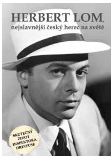
Lomova fotografie z úspěšné komedie Milostná loterie (1954) na obálce hercovy biografie z roku 2015

Z pohledu starého kontinentu se stupňující protikomunistická kampaň v USA zpočátku nezdála až tak