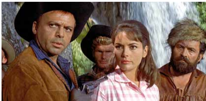
Herbert Lom jako legendární záporák Cornel Brinkley v mayovce Poklad na Stříbrném jezeře (režie Harald Reinl, 1962)

nebo Mel Ferrer. Byl při tom, když u filmu začínali Peter Sellers, Sean Connery a mnozí další. Za natáčení mayovky Poklad na Stříbrném jezeře (1962) inkasoval dvakrát vyšší honorář než francouzský herec Pierre Brice, představitel Vinnetoua.