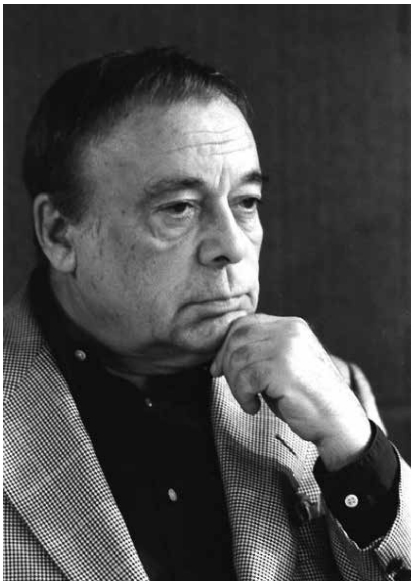
Herbert Lom v roce 1992