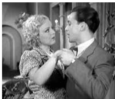
Herbert Lom a Věra Ferbasová na záběrech z filmu Žena pod křížem (režie Vladimír Slavínský, 1937)