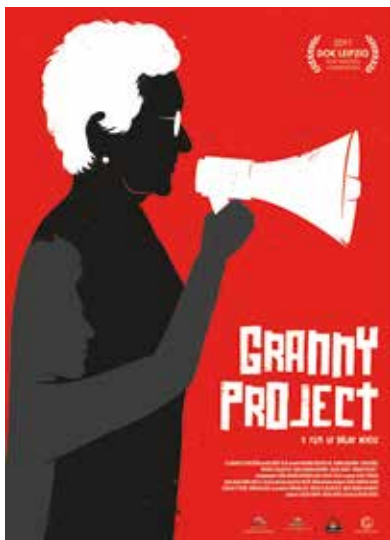
Plakát filmu Projekt Babička ( Granny Project , režie Bálint Révész, 2017)

Diváci, mezi nimiž převažují senioři a lidé středního věku, ale najde se také několik studentů, mají po skončení projekce chuť debatovat. Padají další a další otázky, do diskuse se postupně zapojují většina přítomných. Skupina se pozvolna rozchází a já s překvapením zjišťuji, že jsme více než hodinu hovořili o povaze paměti, kriticky reflektovali, jak vzpomínání funguje a jak se prostřednictvím sdílených představ o minulosti utváří