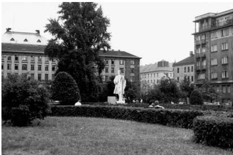
Zkušební snímek makety na místě budoucího pomníku (červenec 1972)

Měřeno dobovými hledisky znamenal monumentální Gottwaldův pomník vytvořený pro hlavní město vrchol sochařovy kariéry. Dvašedesátiletý umělec měl vzhledem ke svým zkušenostem s portrétová-