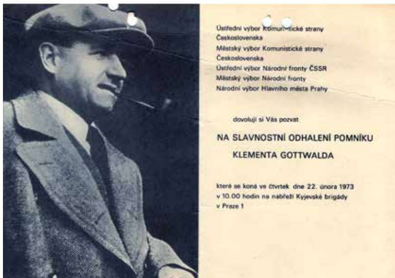
Pozvánka na slavnostní odhalení sochy 22. února 1973

na přepracování návrhu i za cenu nedodržení únorového data instalace. 31 Tento názor však byl oslyšen a ředitel GHMP Kotek dal výtvarníkům pokyn k urychlenému pokračování v práci na základě rozhodnutí příslušnými politickými a státními orgány, aby práce pokračovaly v plném rozsahu tak, aby pomník byl odhalen ve stanoveném termínu. 32 Kameníci tak mohli v prosinci 1972 konečně začít a navzdory zimnímu počasí pokračovaly práce v jejich dílně na staveništi uspokojivým tempem.