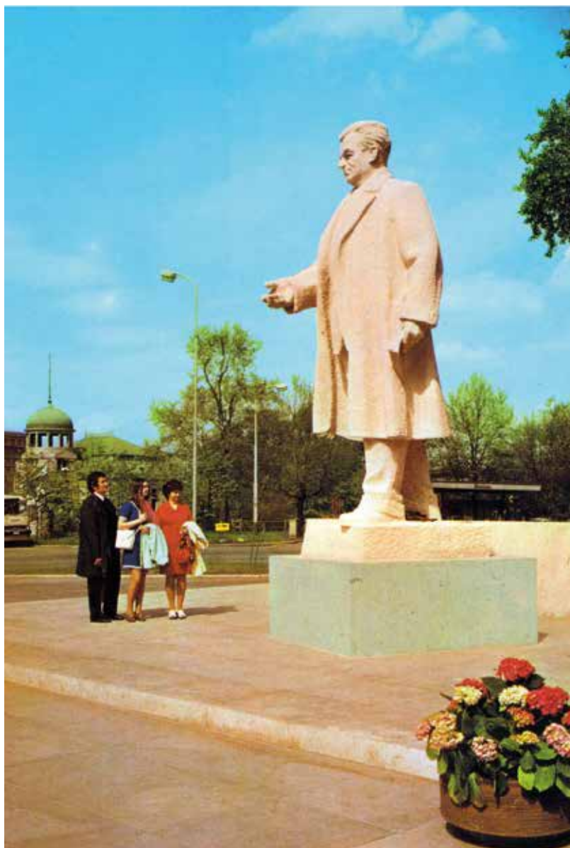
Gottwaldův pomník na dobové pohlednici

Příběh pražského Gottwaldova pomníku je sondou do dějin poválečného československého sochařství a oficiálního umění vůbec. Zachycuje období normalizačních monumentálních realizací, při nichž ideová složka díla hrála zásadní roli. Když Viktor Dobrovolný, služebně nejstarší Gottwaldův portrétista, přijímal prestižní zakázku pro metropoli, netušil, jakým danajským darem celý projekt bude. Špičky vládnoucího režimu trvaly na dodržení termínu odhalení, neboť neúspěch či zdržení by znamenaly šrám na jejich prestiži. Věci dokonce zašly tak daleko, že v zájmu včasného dokončení projektu byla v podstatě ignorována doporučení a stanoviska vlastních kontrolních orgánů. Ideová rada pro péči o pomníky, památníky a pamětní desky jakožto resortní komise ministerstva kultury musela ustoupit zájmům ideologickým a její apel na umělecká kritéria zůstal pouze na papíře.