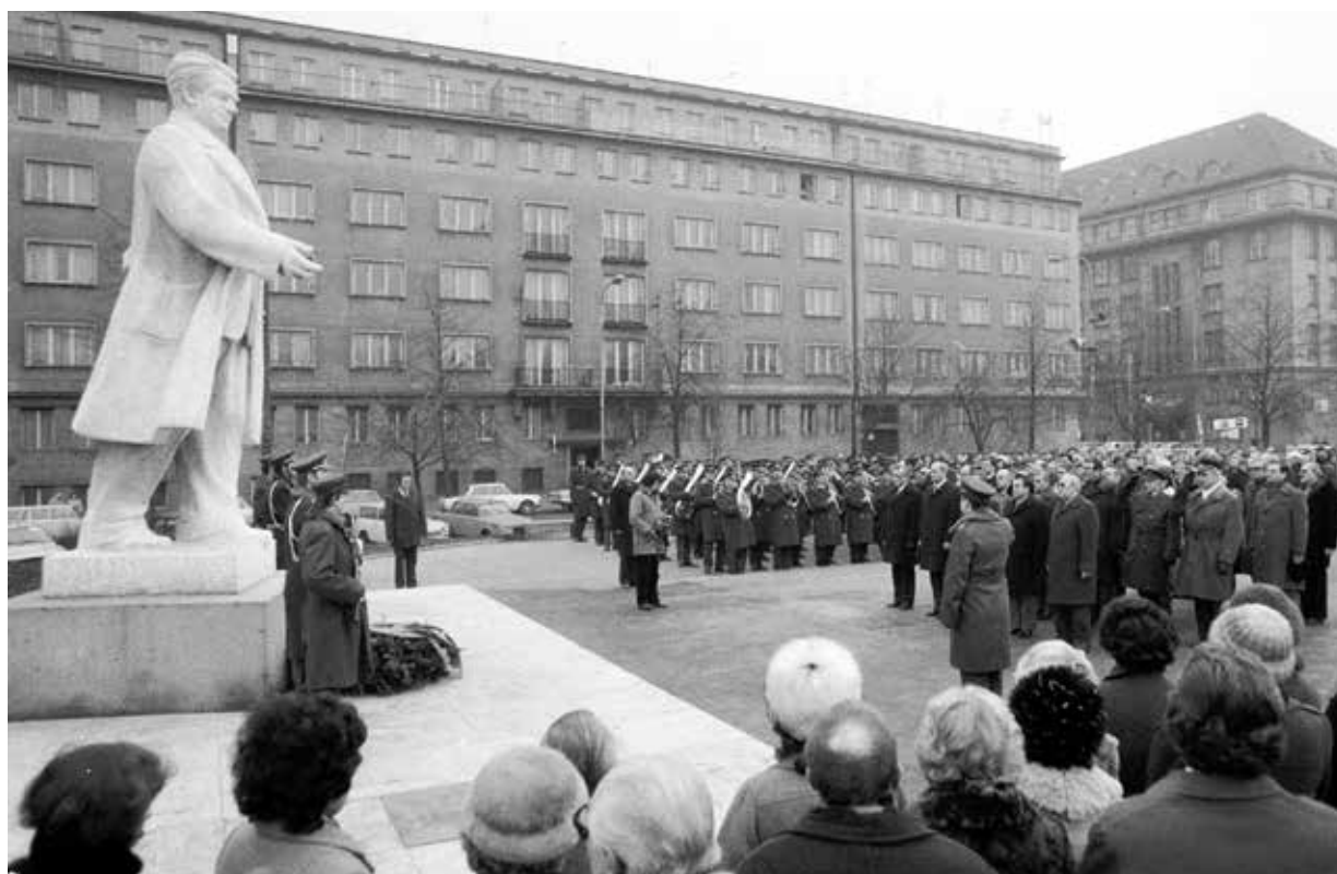
Pietní shromáždění u pomníku Klementa Gottwalda na někdejší nábřeží Kyjevské brigády (dnes Ludvíka Svobody) v Praze 23. února 1984

jméno (podobně jako blízká stanice metra C zprovozněná o rok později, dnes Vyšehrad).