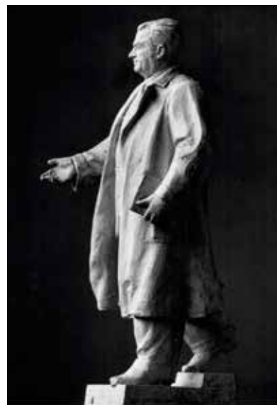
Původní třetinový model – boční pohled