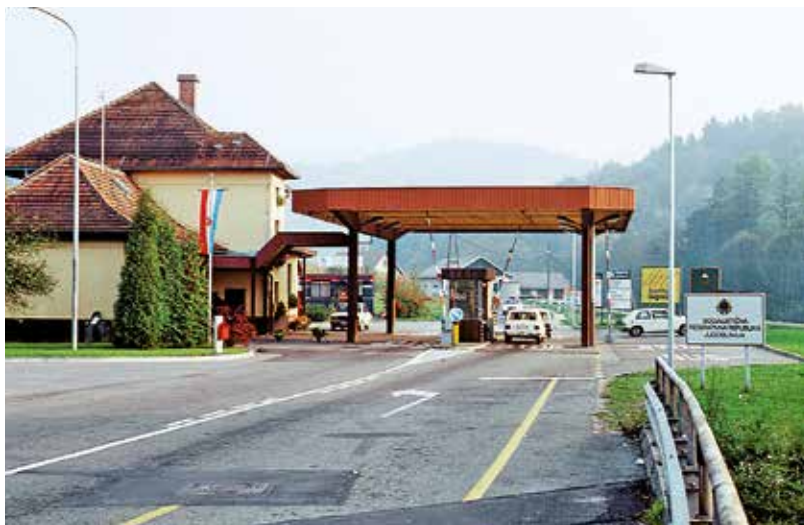
Rakousko-jugoslávský hraniční přechod v 70. letech

Prameny nicméně hovoří i o československých občanech, kteří „jugoslávského mostu“ k emigraci dosáhli bez povolení k cestování do této země. Osvědčeným a relativně snadným způsobem bylo překročit některý rumunsko-jugoslávský hra-