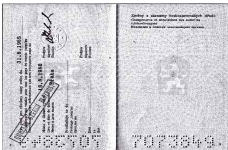
Tzv. šedý pas pro výjezdy do Jugoslávie, přední strana a vnitřní stránky s razítkem omezujícím platnost pasu jen na území SFRJ