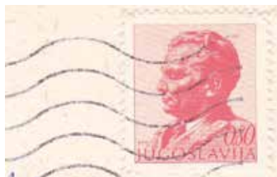
Dobová jugoslávská poštovní známka s prezidentem J. B. Titem a pohlednice z Debelého Rtiče, pláže u obce Ankaran v blízkosti hranice s Itálií, odkud bylo možné přeplavat na italskou stranu