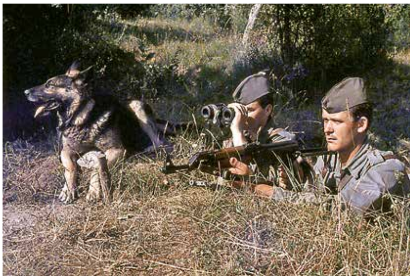
Oficiální dobová fotografie bdělých jugoslávských pohraničníků. Strážci jugoslávských hranic byli vůči emigrantům poměrně benevolentní, nicméně i zde docházelo ke konfliktům s tragickým koncem.