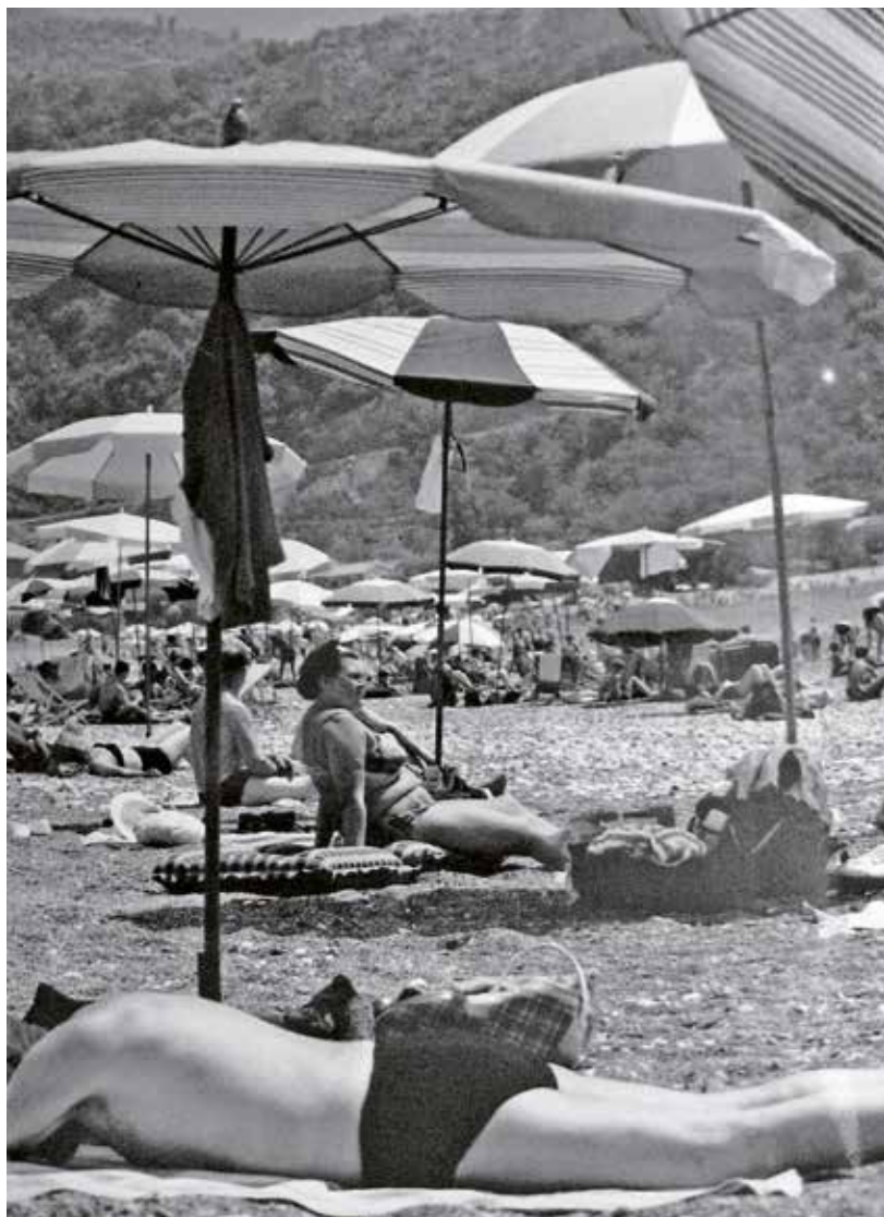
Čeští rekreatanti na pláži v rekreačním středisku ROH v Bečiči v 60. letech