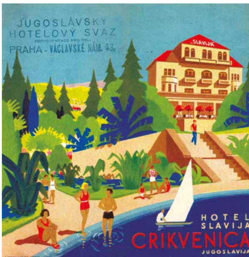
Brožura hotelu Slavija sloužící v Československu pro reklamní účely, konec dvacátých let 20. století

Tento úryvek svědčí o všeobecném zájmu Čechoslováků o Jugoslávii a Jaderské moře v době vyostřených oficiálních vztahů mezi Československem a Jugoslávii. Tehdejší politické napětí však neodpovídalo těsným historickým vazbám mezi českými zeměmi a zeměmi jižních Slovanů. Češi navázali v polovině 19. století výjimečný vztah s oblastmi ležícími u Jaderského moře, s Bosnou a Hercegovinou a také se Srbskem a Černou Horou. Osobnosti, jako například lékař a biolog Vilém Dušan Lambl (1824–1895), novinář Josef Holeček (1853–1929), malíř Jaroslav Čermák (1830–1878) nebo muzikolog a malíř Ludvík Kuba (1871–1956), svým dílem rozšířily nepochybně stereotypní, avšak vesměs pozitivní obraz jižních Slovanů a Jaderského moře mezi Čechy. 2 Na sklonku 19. století se pobřeží patřící tehdy Rakousku-Uhersku stalo významným turistickým cílem a české projekty tam pokračovaly i v meziválečném období. Na jaderském pobřeží (v Malinské, v Bašce na ostrově Krk, v Crikvenici, v Selce, na ostrově Rab, ve Splitu a jeho blízkosti, na ostrově Brač, v Podgoře, na ostrově Vis, v Dubrovníku a okolí,