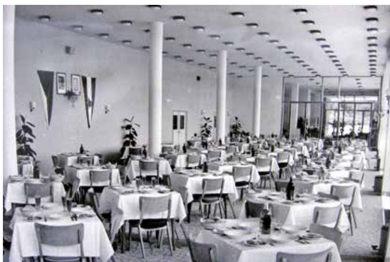
Jídelna rekreačního střediska ROH v Bečići v šedesátých letech 20. století

Jugoslávie politicky nerozlišovala mezi turisty ze sovětského a kapitalistického bloku. Přestože ekonomické rozdělení z důvodu vyšší ceny hotelů, stravy a zábavy de facto existovalo, turistům z Východu nebyly vyhrazeny zvláštní lokality. Těžili proto, stejně jako jejich západní protějšky, z relativně stejné svobody pohybu. Tuto skutečnost, která dělala vrásky československému vedení, však měl vyřešit plán výstavby letoviska ROH v Jugoslávii. Vyslání odborářů do poměrně odlehleho Bečići mělo ztížit jejich kontakt s jugoslávskou společností. Pobyt ve středisku, zajištěný výhradně pro československé odboráře a jejich rodiny, umožňoval reagovat na nárůst počtu žádostí