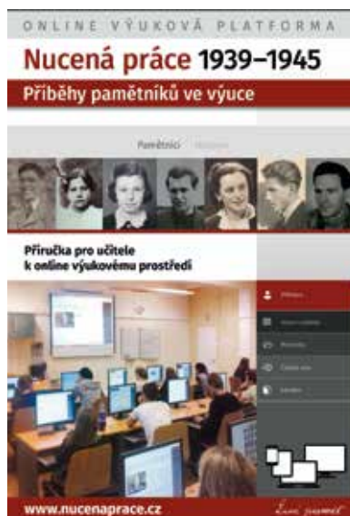
Webovou platformu doplňují také příručky určené žákům i učitelům

Nespornou výhodou tohoto obohacujícího prvku je skutečnost, že si žáci mohou do své pracovní plochy s odpověďmi věty jednoduše a rychle kopírovat. Poměrně snadno si do svého pracovního materiálu mohou také vystříhnout část rozhovoru, což je naučí základy další vcelku potřebné dovednosti (zpracování videa). Velmi cenný je pestrý výběr dobových pramenů k příběhům jednotlivých pamětníků ve složce Materiály (fotografie, osobní dokumenty, korespondence, tabulky a videa, ale také materiály odrážející dobu, ve které se