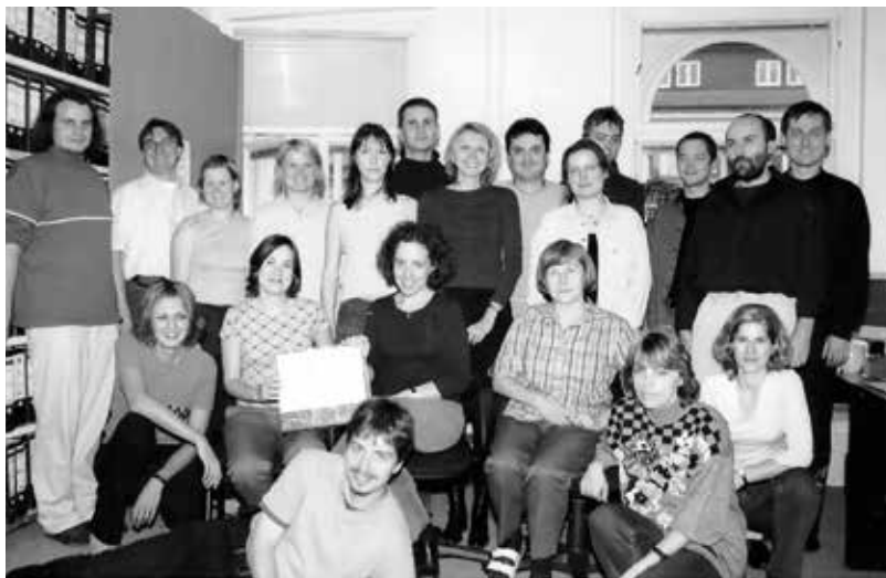
Zaměstnanci ověřovacího a dokumentačního centra Kanceláře pro oběti nacismu při ČNFB, 2001