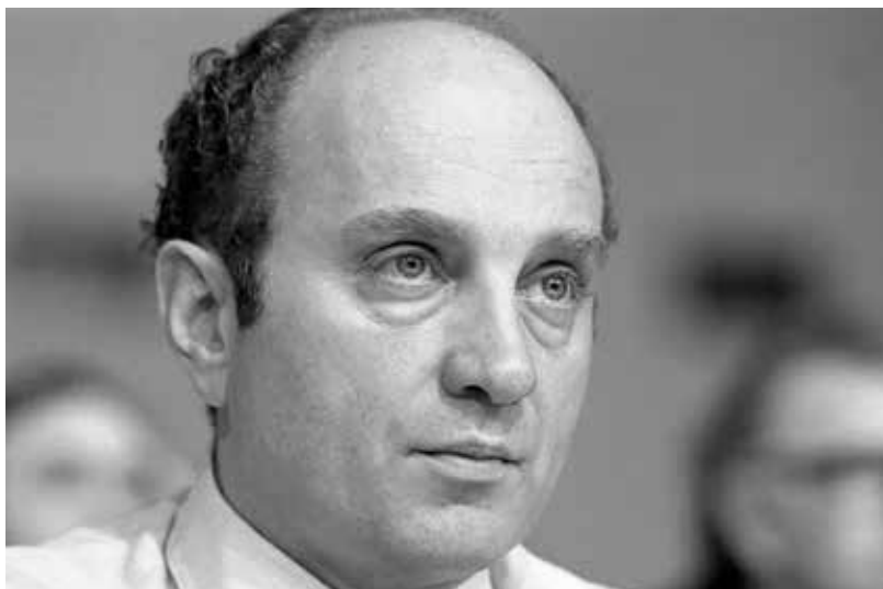
Někdejší německý ministr financí, předseda FDP a diplomat hrabě Otto Lambsdorff

Za německou stranu vedl jednání prvních několik měsíců pověřenec Úřadu spolkového kancléřství Bodo Hombach, který neprojevil přílišnou citlivost. Myslel si, že může z mocenské pozice všechny převálcovat jako buldozer a prosadit svůj pohled na věc. Ale naštěstí Úřad spolkového kancléře brzy přišel na to, že německým zájmům spíše škodí, takže jmenovali hraběte Otto Lambsdorffa, bývalého ministra financí a bývalého předsedu FDP, což bylo zajímavé, protože to byl vlastně představitel opoziční strany. Schröder tím do jednání vtáhnul i opozici. Hrabě Lambsdorff, to byla v Německu těžká váha. Mně bylo 35 let a on byl starý, zkušený pán. Jako vyjednaváč byl hodně tvrdý, ale velmi inteligentní. Prostě chápal, že všichni, kdo sedí u toho stolu, mají nějaké zájmy a že koneckonců bude muset přijít nějaký kompromis. Takže jsme na sebe křičeli, atmosféra byla vzrušená, ale někam to špelo. Nebylo