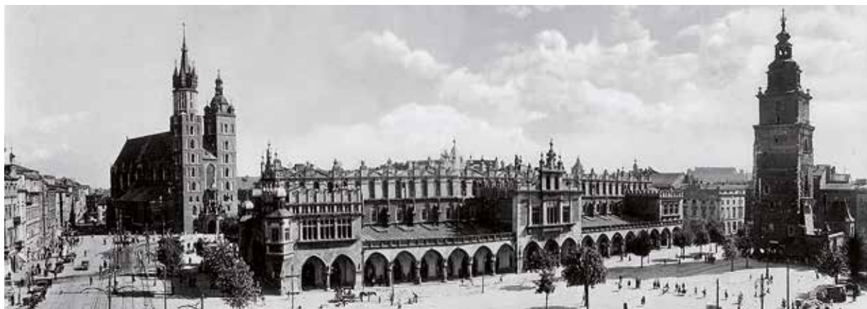
Dobový pohled na krakovské Hlavní náměstí

Velká Británie poskytla Československu deset milionů liber (asi 1,5 miliardy Kč) na rekonstrukci čs. hospodářství a na pomoc uprchlíkům. Dispoziční právo k nevyčerpané části určené pro uprchlíky měl po 15. březnu 1939 British Committee for Refugees from Czechoslovakia, resp. Czechoslovak Refugee Trust Fund (CRTF). 1 Komitét působil i v Polsku. Jeho hlavní úřadovna sídlila v Krakově a měl pobočku v Katovicích, kde byl také britský vicekonzulát.