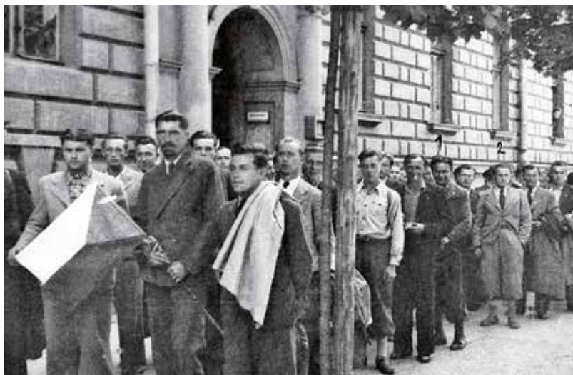
Zástup dobrovolníků hlásících se v létě 1939 do čs. jednotky před budovou konzulátu v tehdejší Potockého ulici č. 8

Šéf čs. konzulátu v Krakově Vladimír Znojenský jako jediný československý diplomat v Polsku zcela jednoznačně odmítl vydat svůj úřad Němcům. Po letech k tomu poznamenal: 15. březen [1939] byla pro nás hrozná rána, a tudíž následovala naprostá dezorientace a zoufalství. Rozhodl jsem se hned, že se nevrátím do protektorátu, ale o odboji nebylo zatím vůbec žádné zmínky. [...] To však jsem již německému konzulovi napsal, že konzulát nevydám. 4 Znojenský tak rozhodl v situaci, kdy čs. vyslanec ve Varšavě Juraj Slávik oznámil rezignaci a odjezd do Spojených států, na vyslanectví nastal chaos, podřízené úřady dostávaly protichůdné příkazy a důsledkem bylo předání konzulátů ve Lvově a v Gdyni Němcům a uzavření honorárního konzulátu v Českém Kvasilově.