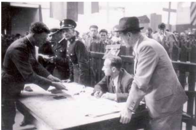
Polská pasová kontrola čs. dobrovolníků před nástupem na loď v Gdyni

Koncem července projevil velení polské armády zájem o čs. specialisty. Již počátkem tohoto měsíce přijalo polské letectvo do svých řad první osmičlennou skupinu vojenských letců, která přiletěla do Polska ze Slovenska. Následně byly stanoveny podmínky pro přijímání čs. letců, které byly obecně příznivější než ve Francii. Přesto u čs. letců zpočátku nenašla polská nabídka větší odezvu. Z třetího transportu odjíždějícího do Francie se těsně před naloděním v Gdyni přihlásilo 13 mužů. Další nábor probíhal v následujících dnech u jednotky v Bronovicích. Koncem srpna bylo k polskému letectvu přijato dalších 72 mužů – celkem se jich tedy v okamžiku vypuknutí války nacházelo v polských službách 93. Asi stovka jich zůstala u čs. jednotky a zhruba 500 odjelo do Francie.