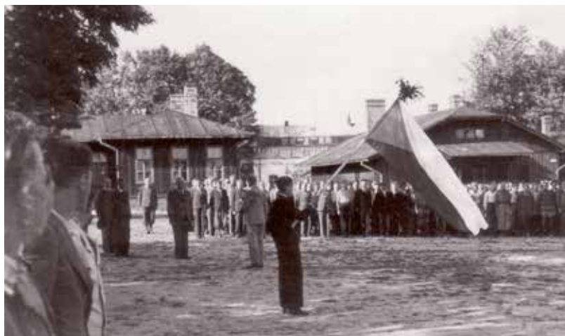
Nástup čs. dobrovolníků odjíždějících 28. července 1939 čtvrtým transportem do Francie, tábor v Malých Bronovicích. Dole čs. dobrovolníci ve vlaku během cesty z Krakova do Gdyně.