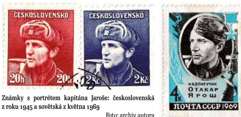
Známky s portrétem kapitána Jaroše: československá z roku 1945 a sovětská z května 1969