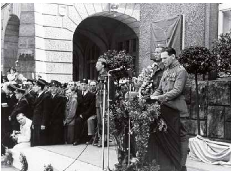
Slavnostní odhalení pamětní desky kapitána Jaroše v Náchodě 28. dubna 1946

Město Mělník nicméně s tímto závěrem nesouhlasilo. Zástupci MNV žádali o umístění pomníku Otakara Jaroše v jejich městě a dopisem se obrátili na ministerstvo národní obrany s žádostí o přehodnocení rozhodnutí. Následně se rozhořel spor mezi oběma městy. Jarošovy rodné Louny nehodlaly ustoupit. MNV Mělník proto v srpnu 1946 dalším dopisem žádal ministerstvo obrany,