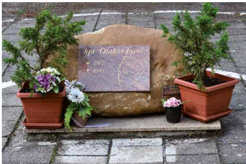
Pomník kapitána Jaroše odhalený roku 2012 na dvoře základní školy v Lounech