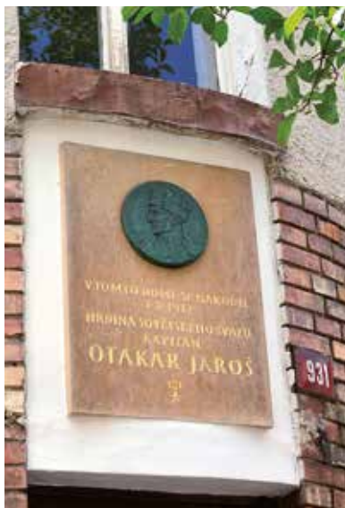
Pamětní deska na rodném domě Otakara Jaroše v Lounech

Svého rodáka si nakonec připomenělo i město Louny. Stalo se tak 8. května 1960 u příležitosti 15. výročí osvobození odhalením pamětní desky na jeho rodném domě v dnešní Jarošově ulici 29 čp. 931. Jejím autorem je akademický sochař Jiří Prádler 30 ,