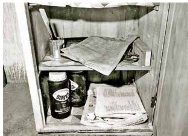
Prostředky k rozmnožování tiskovin