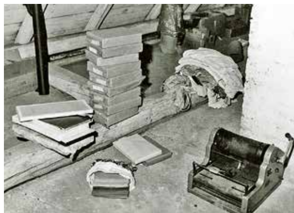
Tajná tiskárna samizdatové literatury umístěná ve sklepě