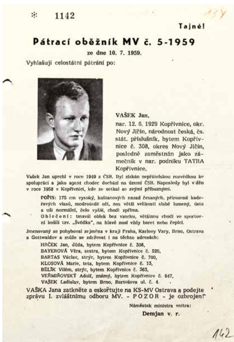
Pátrací oběžník týkající se Jana Vaška