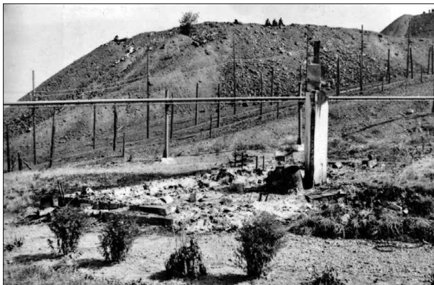
Pohled na shořelou budovu výchovy v NVÚ Bytíz (nahore) a spáleniště kulturně-osvětového baráku tamtéž, srpen 1968