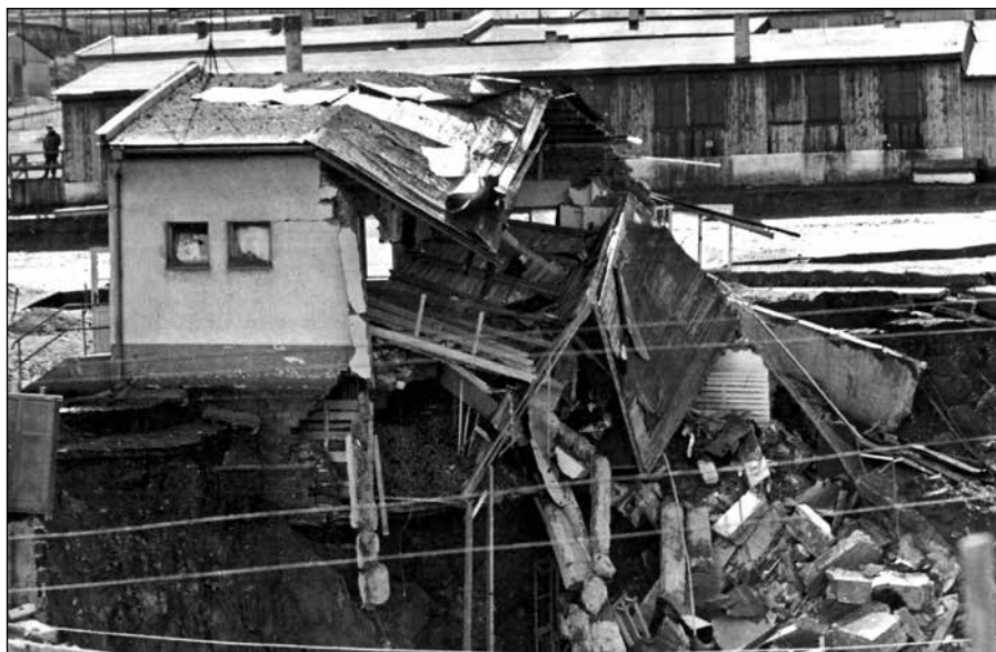
Propad části tábora (kuchyně) NVÚ Bytíz, 1. dubna 1962