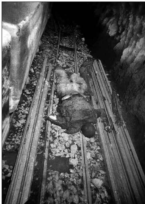
Tělo jedné z obětí důlního neštěstí (výbuch metanu), 20. dubna 1976