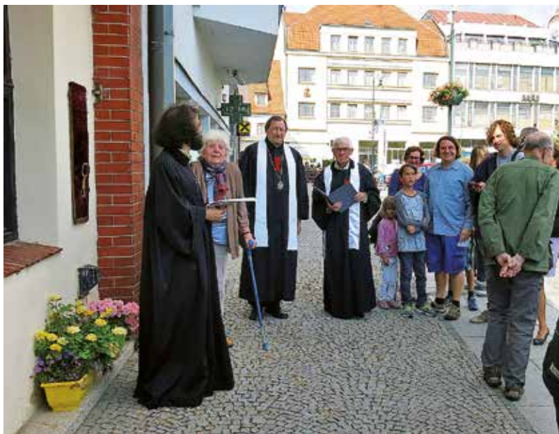
Účastníci setkání před pamětní deskou

Děkujeme všem, kteří našli chuť přispět radou i skutkem či přijeli do Berouna, aby s námi vytvořili živé společenství.