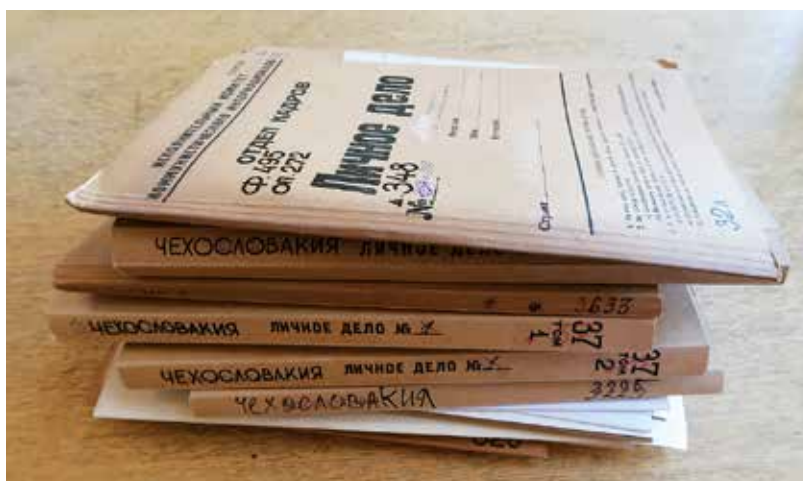
Spisy uložené v RGASPI na čs. občany a Čechy v SSSR a označené nápisem Československo