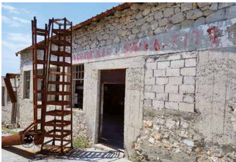
Bývalý koncentrační tábor na Golém otoku