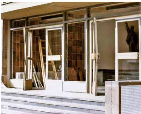
Budova Muzea dělnického a revolučního hnutí v Českých Budějovicích poškozená výbuchem 28. října 1986. Dole kráter prvního výbuchu v parku v Českých Budějovicích.