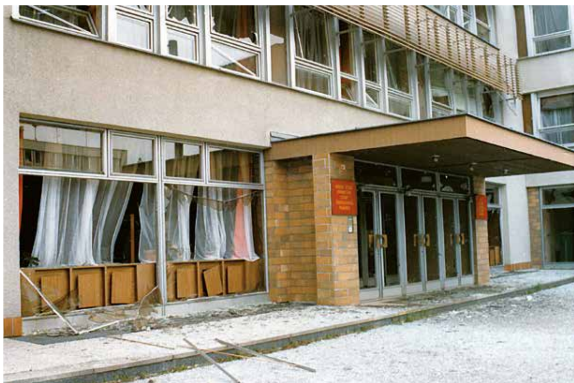
Následky výbuchu 13. září 1988 v Pelhřimově. Přestože byl kráter relativně malý, exploze budovy značně poškodila.