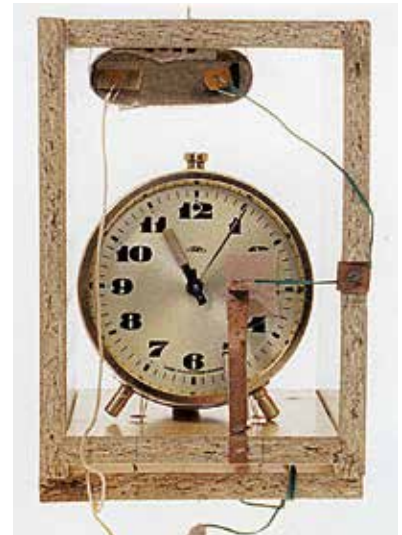
Jediné výbušné zařízení bylo zajištěno 2. dubna 1987 v Plzni. Snímky ukazují způsob zabalení náloží, připojení k rozbuškám a iniciační zařízení – budík s baterií v dřevotřískové krabičce.

Správa StB Praha. Pravděpodobný pachatel byl údajně odhalen. Vyšetřovatelům se jej ale nepodařilo bezpečně usvědčit, nebyl tedy potrestán. 9