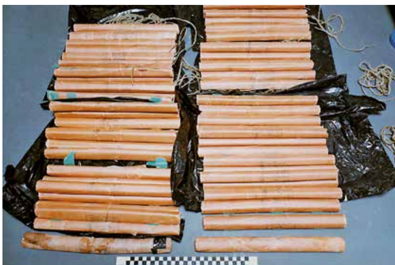
Nálože trhaviny Gelamon

Až 10. ledna 1989 byl 2. oddělením 10. odboru II. správy SNB v Praze založen agenturně pátrací svazek „Exploze“. Bylo to poté, co byla nalezena spojitost mezi prvními třemi akcemi. Stalo se tak teprve měsíc před dalším výbuchem v Ústí nad Labem. 6 Vznikl celostátní řídicí štáb akce „Exploze“, jehož vedením byl pověřen zástupce náčelníka Správy vyšetřování StB. V akci bylo vedeno trestní stíhání neznámého pachatele. V Plzni pro trestný čin obecného ohrožení podle § 179 trestního zákona, na odborech vyšetřování StB v Českých Budějovicích a Ústí nad Labem pro trestný čin záškodnictví podle § 95 trestního zákona. Vyšetřovatelé byli přesvědčeni, že jde o stejného pachatele. Podle poznatek SNB měl pachatel možnost získat východoněmeckou průmyslovou trhavinu Gelamon, byl zkušný v zacházení s trhavinami a manuálně zručný, s přístupem k dílenskému vybavení. Jezdil autem (pravděpodobně červenou Škodou 100 či 105 nebo 120). Takové vozidlo bylo spatřeno poblíž míst výbuchů. Šlo ale o velmi rozšířený typ, proto jej nebylo možno identifikovat. V Plzni se u nevybuchlého zařízení podařilo zjistit stopy krevní skupiny AB. Před žádným z výbuchů nikdo nevaroval a ani později se k němu nikdo nepřihlásil. Nepodařilo se objevit jasný politický impuls, podle kterého by se dal odvodit výběr místa uložení výbušných