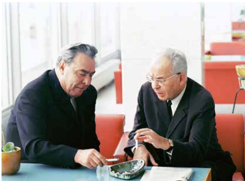
Gustáv Husák s Leonidem Brežněvem, Moskva 1969

Jak vážně myslel za války svou zprávu do Moskvy z července 1944, ve které koketuje s vizí připojení Slovenska k Sovětskému svazu. Zda to byla snaha zalíbit se Moskvě, nebo vystrašit Londýn, protože Beneš byl zapřísáhlý čechoslovakista a neuznával samostatný slovenský národ, či zda chtěl Slovensko skutečně připojit. Zeptal bych se také na to, jaké vize zastával v roce 1969, co si opravdu myslel o příčinách pádu helikoptéry s jeho druhou manželkou. Tuším, že uvažoval o tom, že havárii způsobili Sověti – jako zdvižený prst, aby nejednal příliš samostatně. A pak by mě zajímal listopad 1989, zda a jaké tehdy byly kontakty se sovětskou stranou. Je