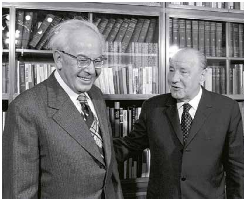
Gustáv Husák s Jánosem Kádárem při návštěvě Budapešti, 1977

Je pravděpodobné, že kdyby se byl hned na počátku procesů přiznal k vykonstruovaným zločinům, skončil by na popravišti. Vždy ale svoje přiznání odvolal. Narušoval tak přípravu monstprocesu, nemohl být dosazen jako jeho součást, jelikož by nabourával jeho propagandistické vyznění. Vyšetřování potom směřovalo jinam, proměnilo se v boj proti sionismu s hlavním představitelem