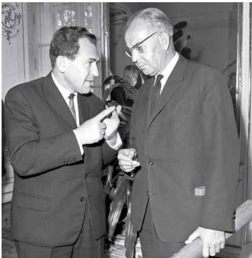
První tajemník ÚV KSS Vasil Biľak a místopředseda vlády Gustáv Husák, právě dekorovaný Řádem Klementa Gottwalda, Pražský hrad 30. dubna 1968

hlasových a televizních archivech, tisk totiž peprnosti zpravidla vynechával. Husák se s dávkou pichlavosti dokázal vypořádávat i s protivníky, a to už od třicátých let. Pro ty, kdo ho znali, to nebyla žádná novinka.