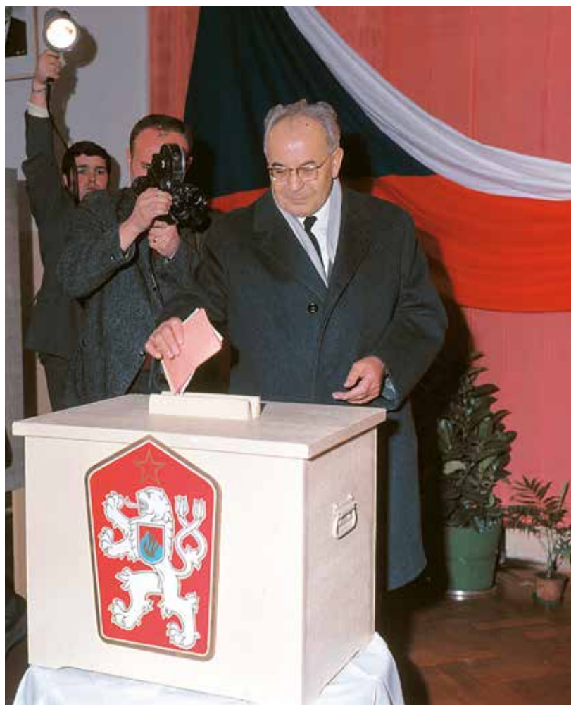
Gustáv Husák při volbách v roce 1971

Stal se lídrem i symbolem československé normalizace, oněch dvaceti let společenského úpadku, a v závěru svého života působil jako směšný, bezmocný stařec. Gustáv Husák byl ale komplexnější osobností. První jeho ucelenou historickou biografii loni vydal historik Michal Macháček.