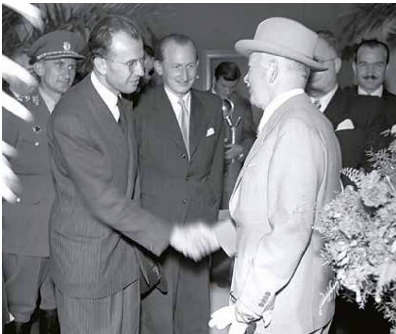
Prezident Edvard Beneš se na zájezdu v Topoľčiankách zdraví s Gustávem Husákem, předsedou Sboru pověřenců, 14. září 1947

Původně jsem knihu koncipoval do roku 1969, kdy se Husák dostal do čela KSČ. Ale nakonec jsem dal na názor přátel a kolegů, kteří považovali za přínosné i žádoucí, aby práce měla komplexní charakter a abych mimo jiné využil dosud neznámé poznatky z moskevských archivů, které se mi