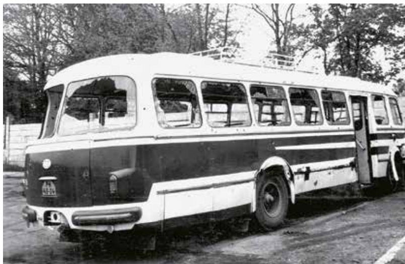
Autobus unesený bratrance Barešovými, rozstřílený příslušníky PS

Potom důstojníci pohraniční stráže sdělili únoscům podmínky: ministr vnitra souhlasí s jejich odjezdem na