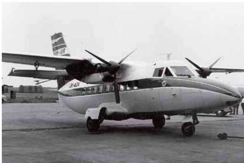
Letoun L-410 Turbolet unesený Lubomírem Adamicou a jeho komplici