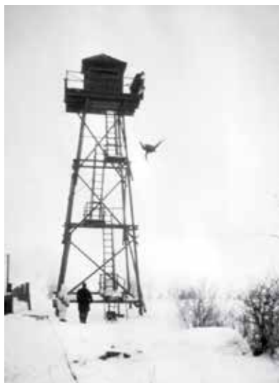
Pokusné svrhávání makety lidské postavy z Trigonometru