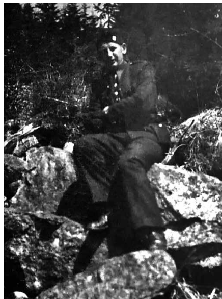
Tentýž muž ve stejnokroji vězeňské stráže v roce 1946...