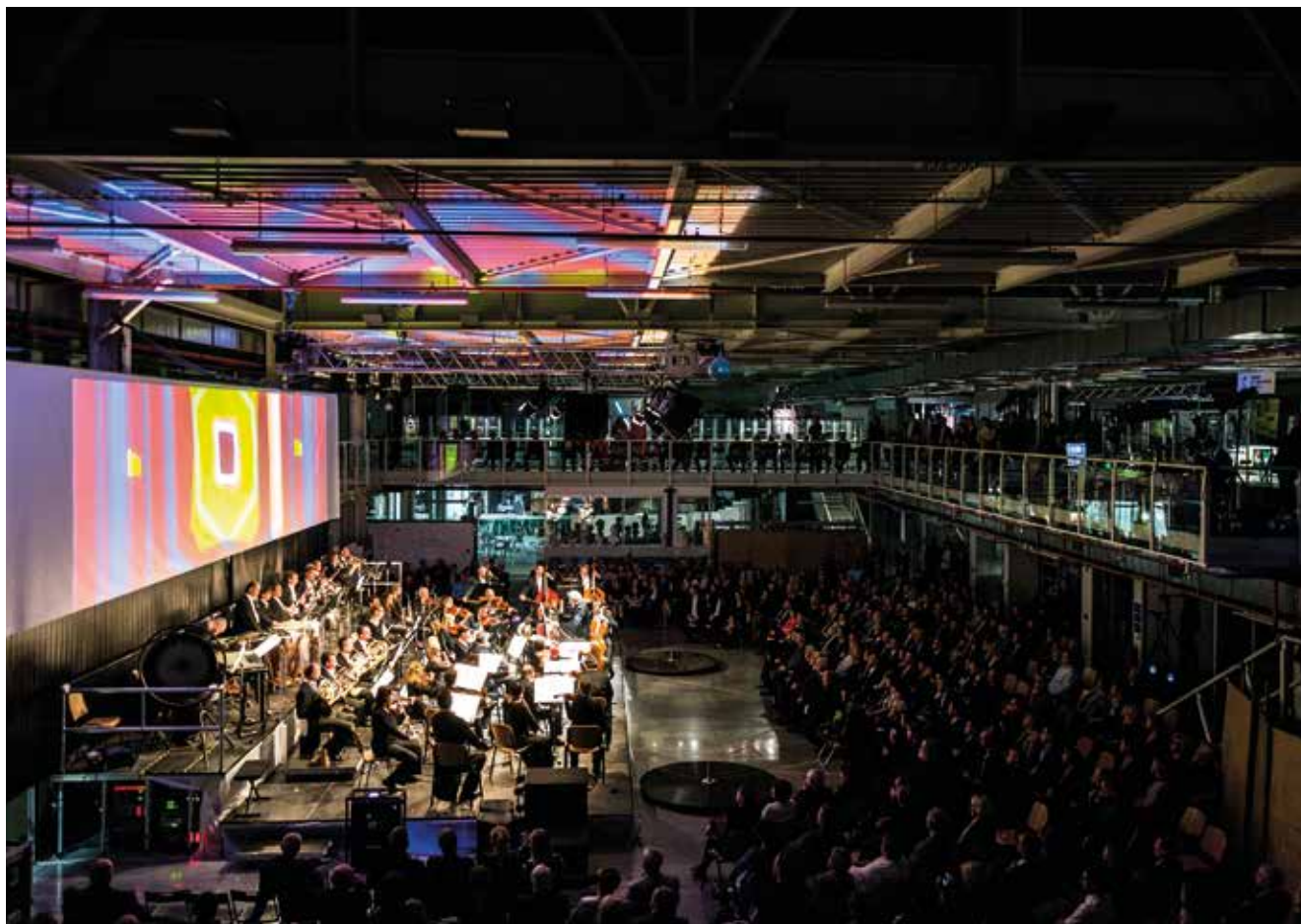
Galavečer k výročí Západočeské univerzity.

Umělecké metafory mají sílu překlenout i distance prostoročasu. Dokážou pomocí ironizující nadsázky zajistit nadčasové útočiště v bídných dobách. Dokážou zachovat tichou rezistenci v ukřižované budovatelské extázi. Mají čarovnou moc. Promění například Stalinův pomník ve „Frontu na maso“. Promění Gottwaldovo: Čelem k masám! na „K masu čelem!“