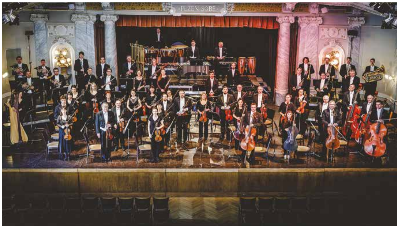
Plzeňská filharmonie v roce 2015.