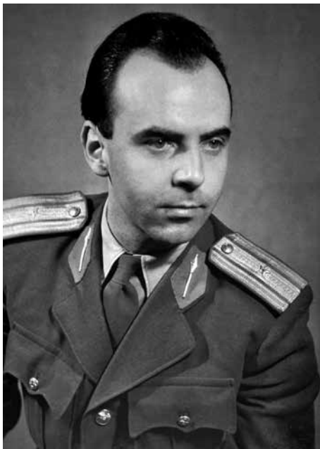
Hudební skladatel Radim Drejsl.