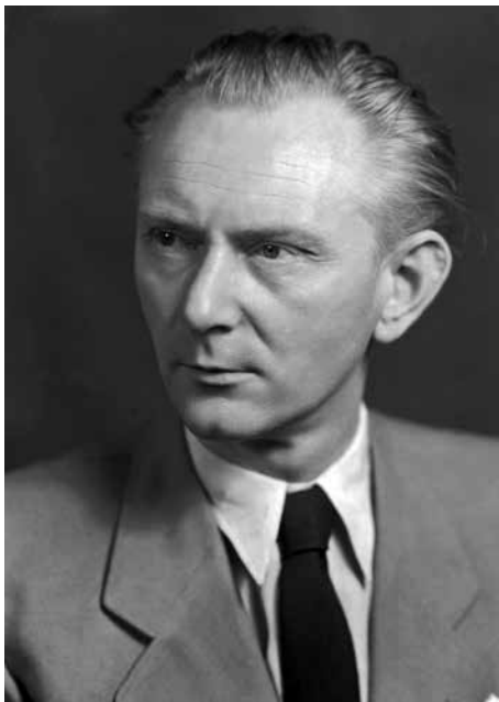
Hudební skladatel Jan Seidel v roce 1950.