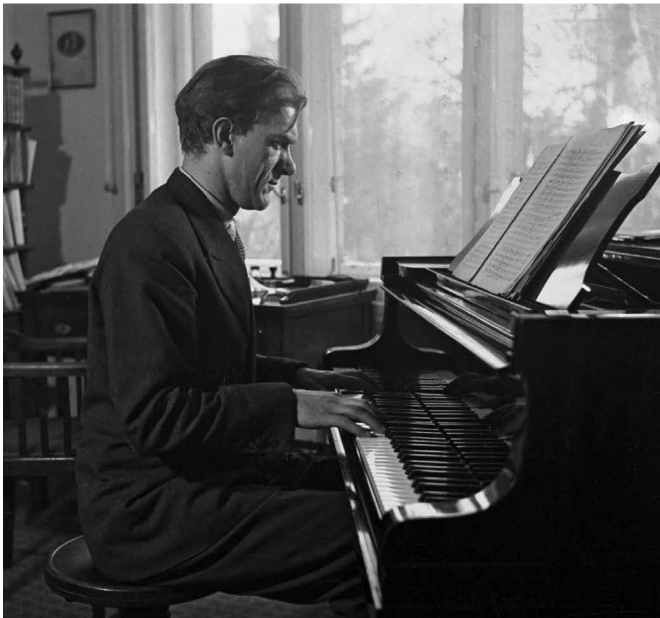
Hudební skladatel Václav Dobiáš v roce 1951.