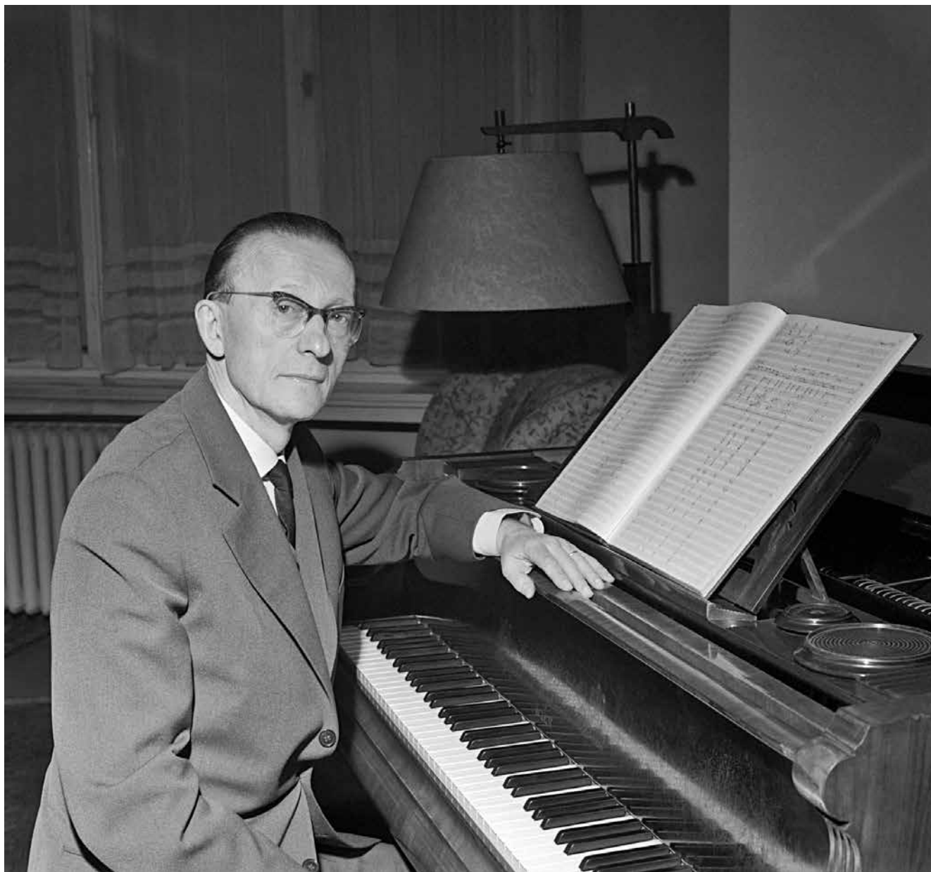
Hudební skladatel Miloslav Kabeláč v roce 1965.