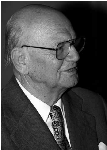
Hudební skladatel Klement Slavický v roce 1995.

hlubší lidové hudební tradici, zajišťuje jmenovaným dílům popularitu i v zahraničí. V Otvírání studánek se Martinů vrátil k nejprostší zpěvné linii, k úspornému instrumentálnímu doprovodu, k základním harmoniím a rytmům, dosáhl přitom ale výsostně uměleckého sdělení, v němž rezonuje vzpomínka na krajinu jeho dětství, úcta k předkům, z nichž vzešel, hluboký stesk po domově, od něhož ztratil více než pomyslný klíč. Tato dnes v nejlepším slova smyslu zlidovělá a populární díla ční nad dobovou produkcí jiných, jinak technicky neméně dobře vyškolených skladatelů.