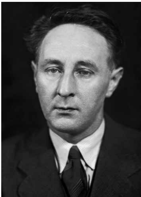
Hudební skladatel Bohuslav Martinů v roce 1938.