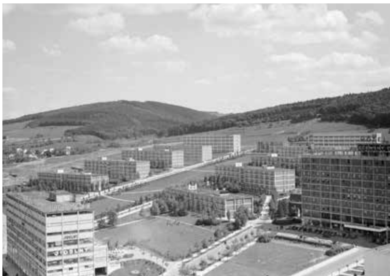
V menší budově uprostřed sídlila zlínská úřadovna Gestapa