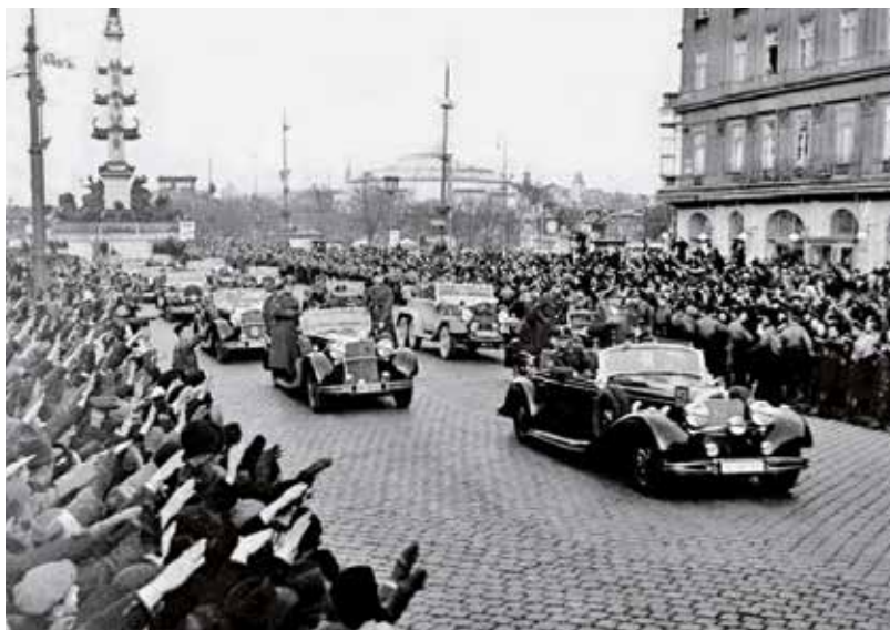
Anšlus Rakouska - kolona Hitlerových vozů ve Vídni