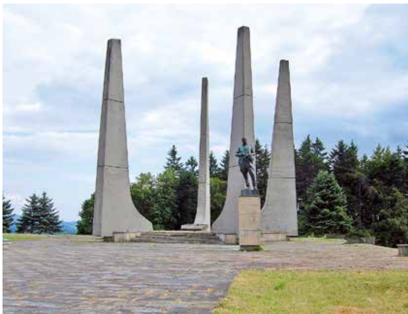
Památník v místě zaniklé osady Ploština, kterou 19. dubna 1945 vypálili nacisté