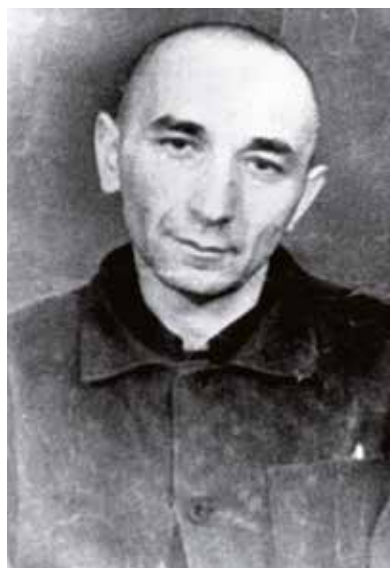
Arsenij Roginskij v pracovním táboře, 1982