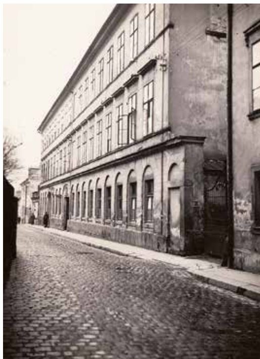
Budova libereckého policejního ředitelství na snímku z konce listopadu 1935