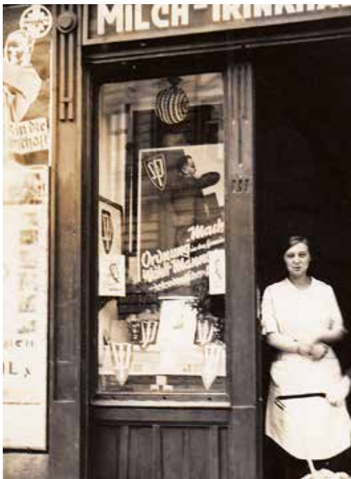
Střelecká ulice (dnes 5. května). Zaměstnankyně mléčného bufetu zřejmě netuší, že se usmívá do objektivu policejního fotoaparátu.