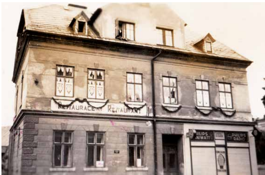
Růžodol I, č. p. 125