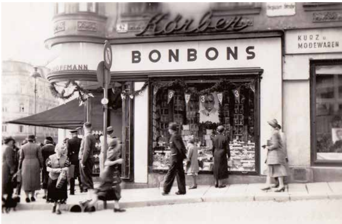
Schückerova (dnes Pražská) ulice č. 42