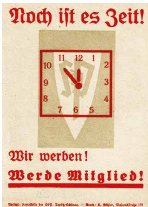
Předvolební agitace SdP na jaře 1938. Ještě je čas, ale je už za pět minut dvanáct...