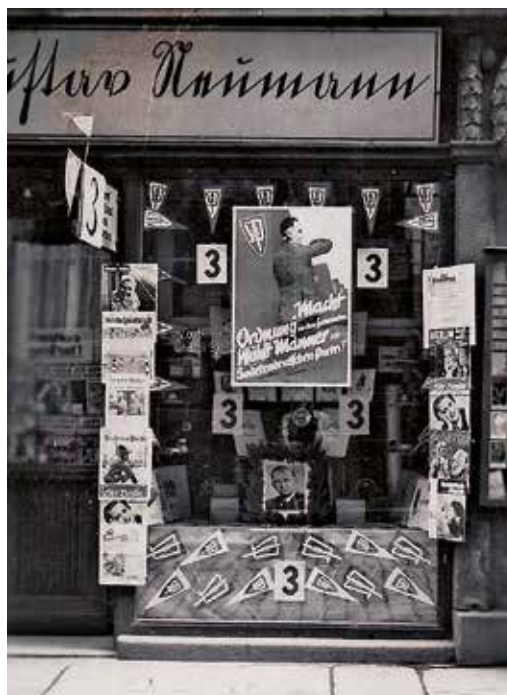
Nádražní ulice č. 15 (dnes 1. máje). Trafika nabízí kromě henleinovské propagandy téměř výhradně říšskoněmecké časopisy.