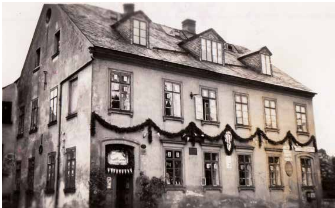
Chrastavská ulice č. 50