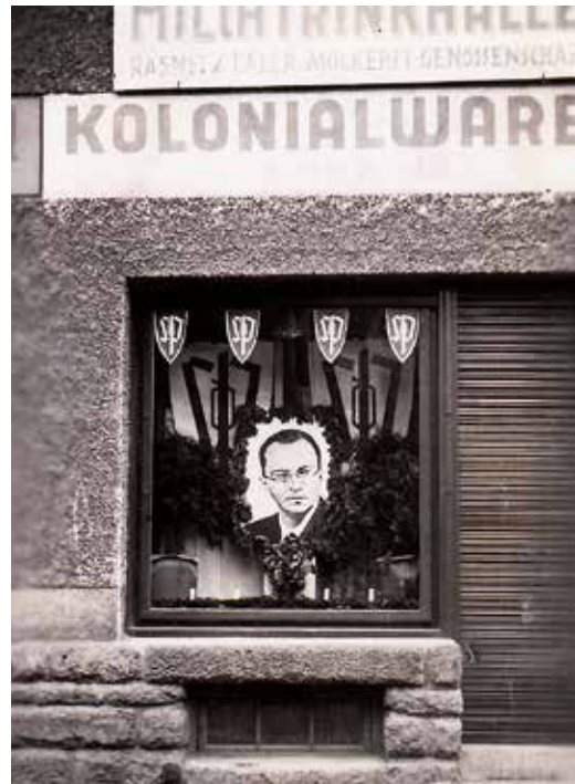
Masarykova ulice č. 113. Sudetský „Führer“ a koloniální zboží.