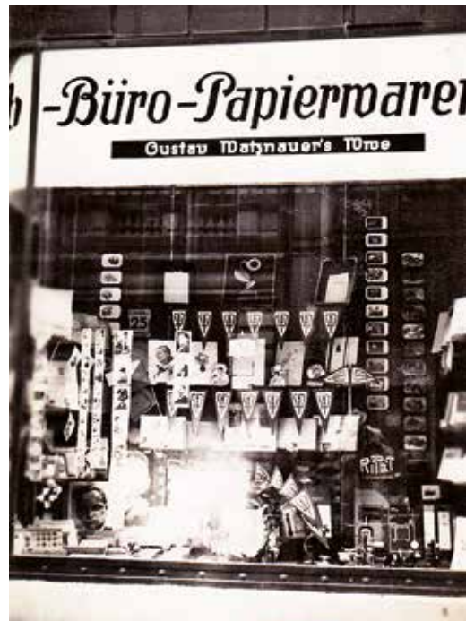
Roh ulic Střelecké (dnes 5. května) a Na Okrouhle č. 6. Stranický propagační materiál se prodával v politicky spřízněných papírnictvích.