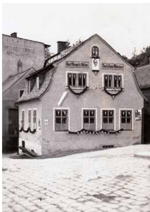
Turnerská třída č. 7 (dnes Sokolská ulice)