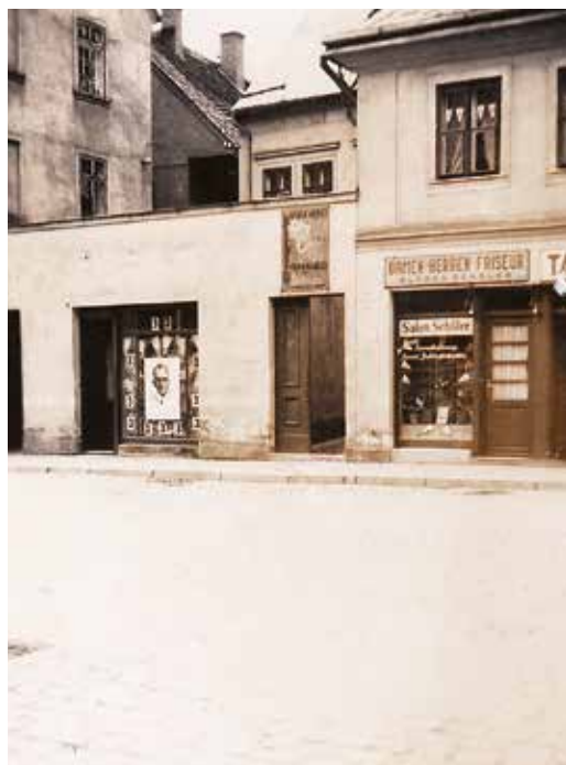
Koňské řeznictví na Malém náměstí č. 1