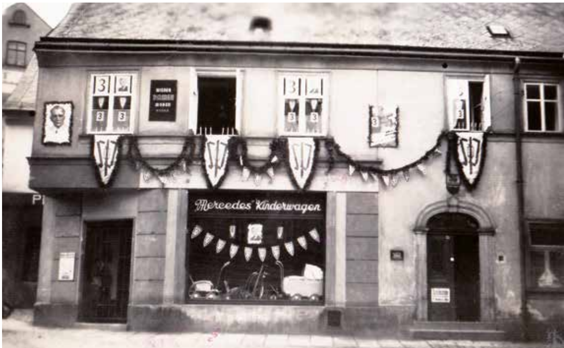
Vídeňská ulice č. 35. Mercedes mezi kočárky a místní vůdce.