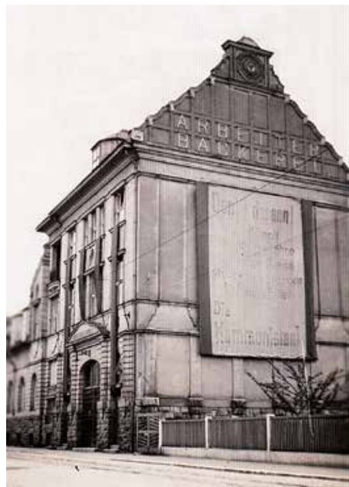
Dělnická pekárna na Hanychovské ulici č. 1 (i na fotografii dole), od roku 1958 památkově chráněná industriální stavba z let 1910–1919, byla jednou z posledních bašt KSČ v „hnědém“ Liberci.