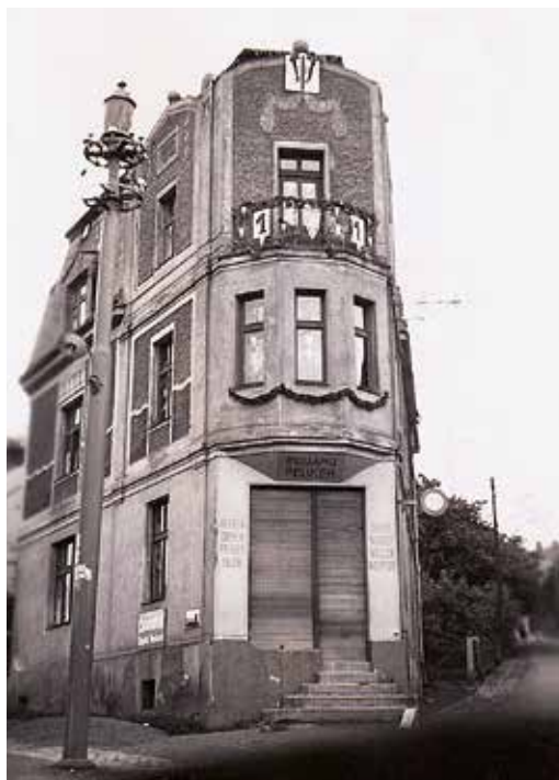
Růžodol I, č. p. 216. Na rozdíl od Liberce, kde si SdP vylosovala číslo kandidátky 3, kandidovali „muži Konrada Henleina“ v Růžodole, patřícím do liberecké aglomerace, pod číslem 1. Růžodol byl připojen k Liberci až 1. května 1939.