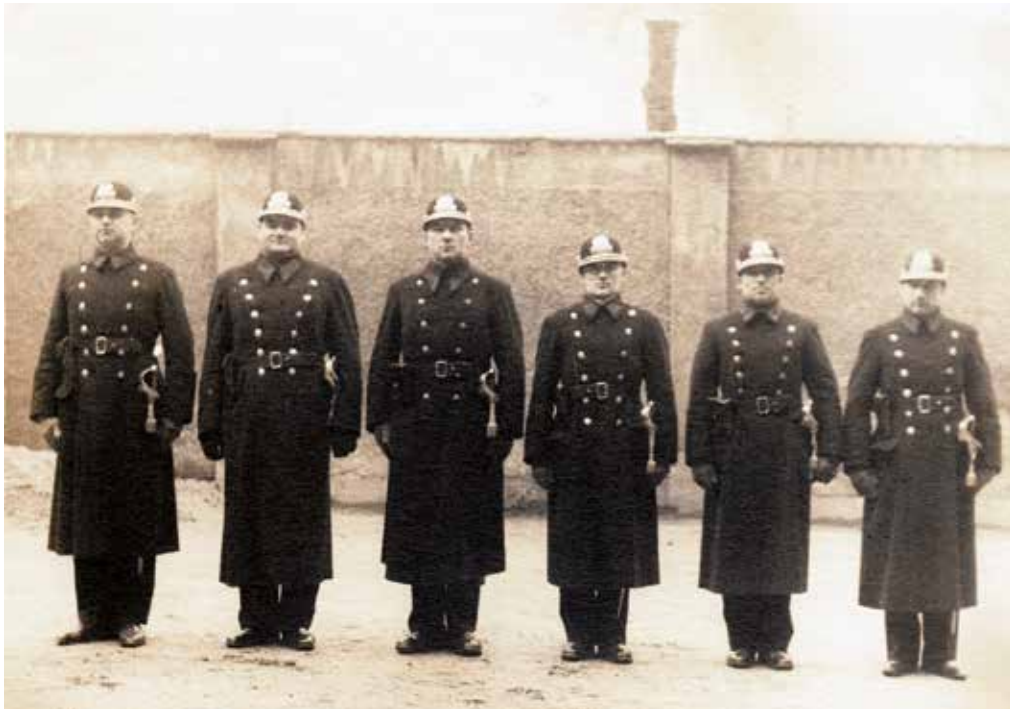
Strážníci čs. státní policie v Liberci ve třicátých letech 20. století