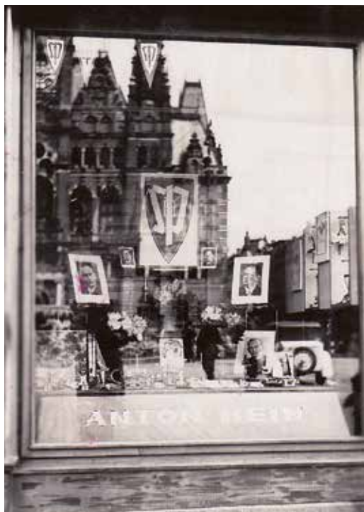
Staroměstské náměstí č. 10 (dnes náměstí Dr. Edvarda Beneše). V odrazu výkladní skříně liberecká radnice, kterou po volbách v roce 1938 zcela ovládla Henleinova SdP.