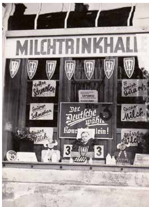
Střelecká ulice č. 44 (dnes 5. května). Další mléčný bar stojící za Konradem Henleinem.