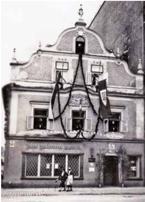
Masarykovo (nyní Sokolovské) náměstí č. 8. Dnes, tak jako kdysi, restaurace „Zlatý beránek“.