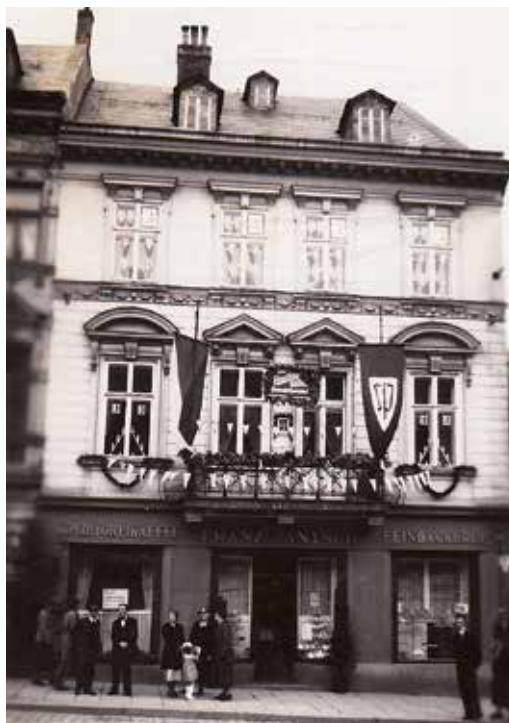
Opatrnější henleinovci vyvěšovali vedle stranické i československou státní vlajku, jak to bylo vyžadováno např. na politických schůzích nebo v průvodech.