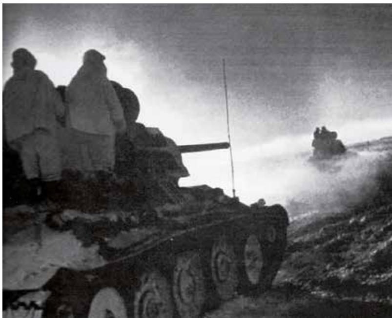
Sovětské síly během operace „Malý Saturn“

Nicméně i kusé informace o pohromě na Východě vnesly do dosud převážně důvěřivého smýšlení protektorátních Němců jistý neklid: Panují obavy, že Rusové podobně jako v předchozím roce opět vrazí do německých postavení s velkou materiální a lidskou silou a poté mohou vrhnout německou frontu zase zpět. 32 Oficiální tisk se