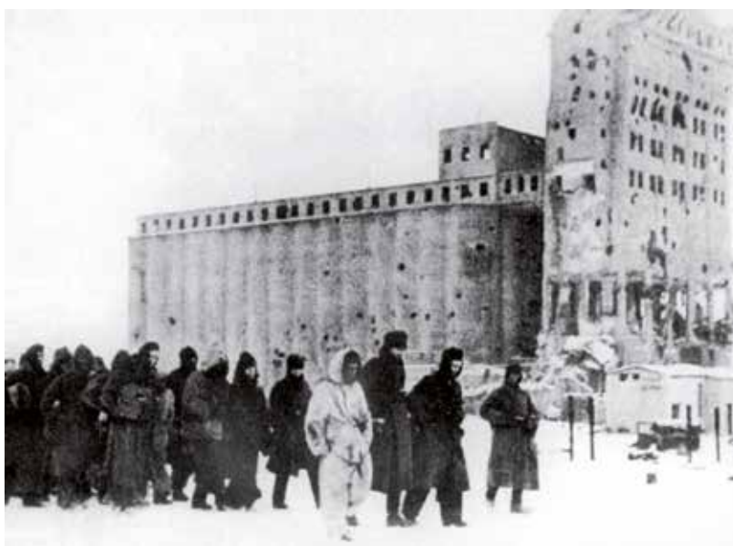
Katastrofa z kraje roku 1943. Zajatí němečtí vojáci procházejí kolem stalingradské sýpky.

Na přelomu ledna a února 1943 v souvislosti s ukončením bojů ve Stalingradské oblasti nakonec musela změnit tón i nacistická propaganda. Goebbels si ještě na Nový rok optimisticky zapsal do svého deníku: Situace na východě se trochu stabilizovala. Nechceme chválit den před večerem, ale že je to s námi poněkud lepší, vidí i v nepřátelských médiích, která vystupují