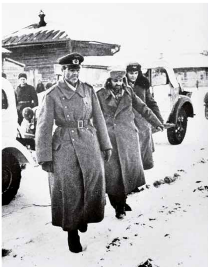
Konec stalingradského kotle. Polní maršál Paulus se chystá kapitulovat.

Protektorát Čechy a Morava jako okupované území představoval prostor, kde měl dopad stalingradské bitvy na veřejné mínění diametrálně odlišný účinek u Čechů a Němců. Českému obyvatelstvu potvrdila beztak už dlouho převažující přesvědčení, že Německo jednoznačně spěje k porážce. Vedla dokonce k předčasným závěrům, že je blízko celkového zhroutení. Tato paralela s koncem první