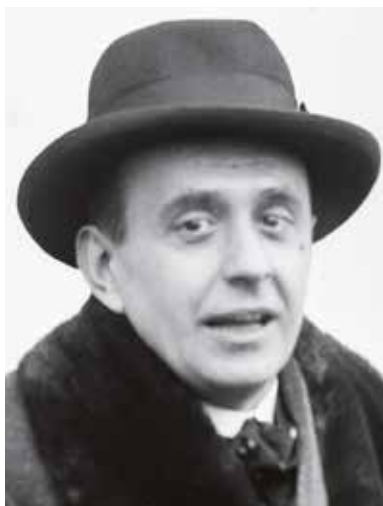
Jan Masaryk: Hitler letos v létě nemůže vyhrát válku. Přeloženo do češtiny: Už ji nemůže vyhrát vůbec.

Mezi Němci pochopitelně panovalo všeobecné mínění, že vojenská síla