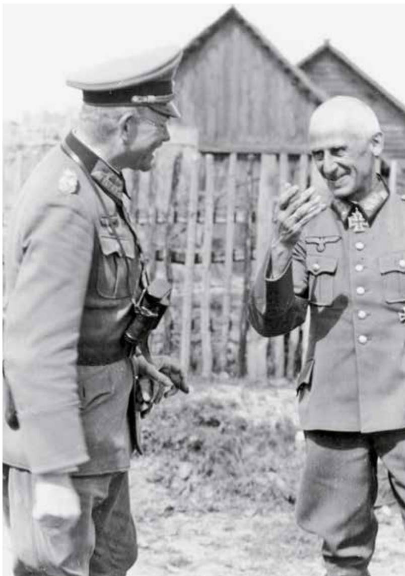
Generálplukovník Hoth (vpravo) velel poslednímu pokusu prolomit stalingradské obklíčení

Bezprostřední reakce a nálady protektorátního obyvatelstva o Vánocích nejsou zaznamenány. Zatímco vojáci na východní frontě hladověli a mrzli, příslušníci SD si užívali vánočních svátků a teprve po jejich skončení se dál věnovali zpravodajské činnosti. Novoroční relace proto omezili na obecné závěry. Mezi Němci zatím údajně stále panovala důvěra v úspěšné řešení krize, zato Češi měli během Vánoc vysloveně sváteční náladu, která se projevovala výroky typu: To jsou poslední vánoce, které slavíme v Protektorátu apod. V nastupujícím roce pak očekávali porážku Osy a osvobození Československa spojeneckými