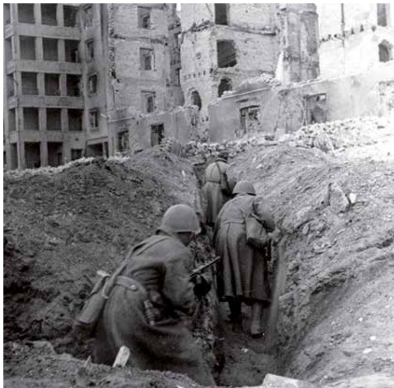
Sovětské vojáky v zákopech uprostřed ruin Stalingradu