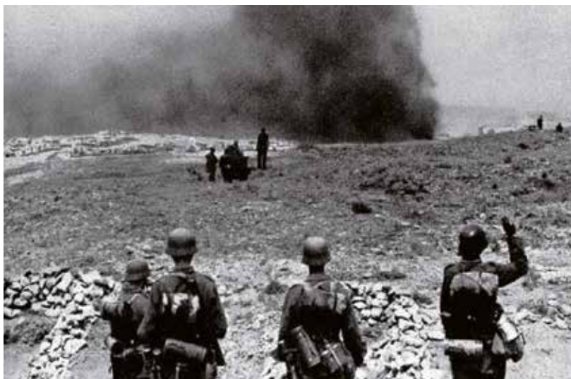
Němečtí vojáci se blíží k hořícímu Sevastopolu