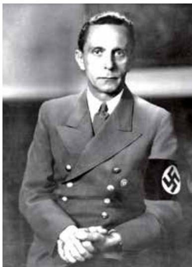
Nálady říšského ministra propagandy Goeb- belse kolísaly od přesvědčení, že Stalingrad každým dnem padne, k silným pochybnos- tem o výsledku

S tím, jak boje ve Stalingradu do- znávaly stále vleklejšího charakte- ru, stávaly se stále méně tématem armádních hlášení, která nyní zdů-