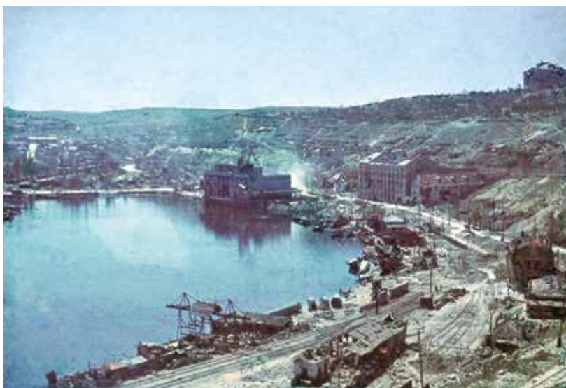
Zničený přístav v Sevastopolu