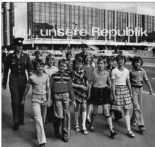
Orchester und Soldatenchor des Wachregiments Berlin ·Felix Dzierzynski· des Ministeriums für Staatssicherheit

Dlouhohrající deska Ty, naše republika orchestru a pěveckého sboru strážního pluku „Felix Dzeržinskij“ Ministerstva státní bezpečnosti NDR (Stasi) z roku 1979