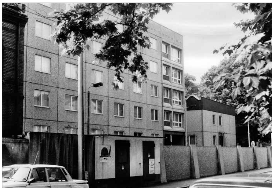
Okresní služebna Stasi v Lipsku, 1990