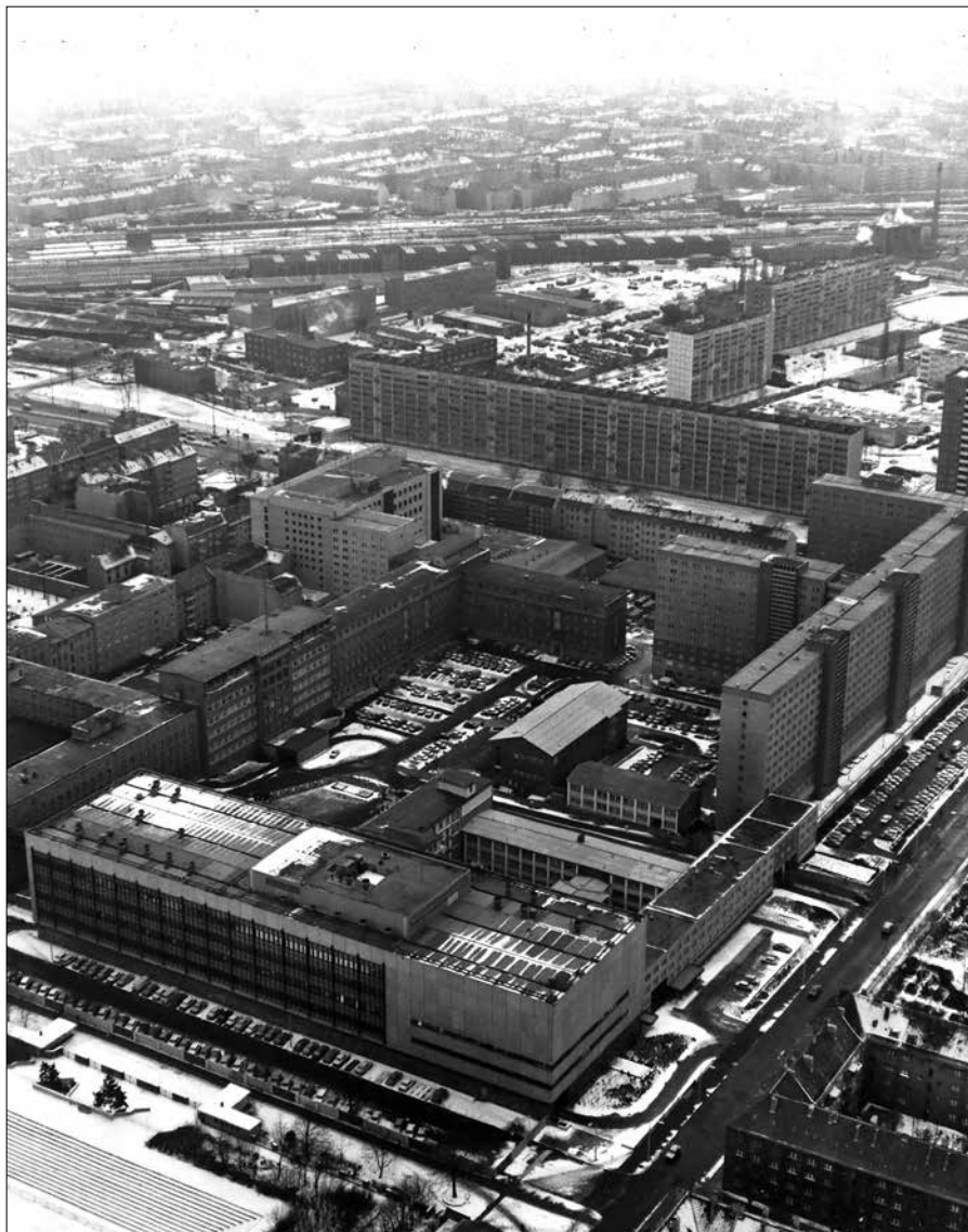
Letecký pohled na komplex budov ministerstva státní bezpečnosti (Stasi) v ulici Frankfurter Allee ve východoberlínské čtvrti Lichtenberg, osmdesátá léta 20. století