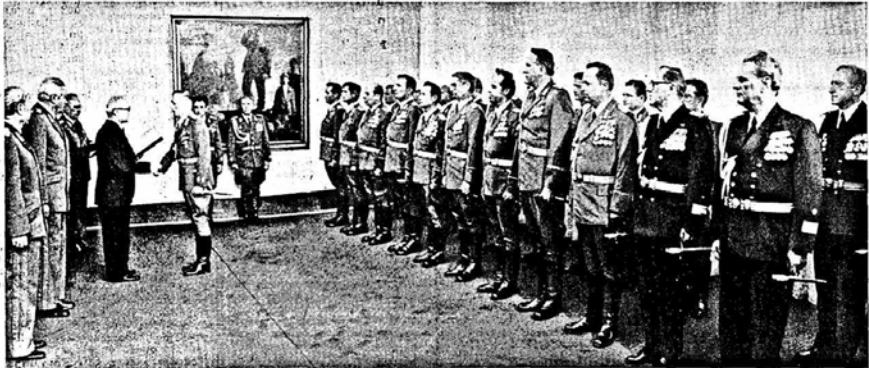
Während der Übergabe der Ernennungs- und Beförderungskunden an die Generale und Admirale der NVA und der Grenztruppen der DDR