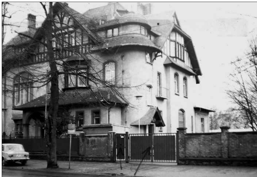
Krajská správa Stasi v Lipsku, nedatováno