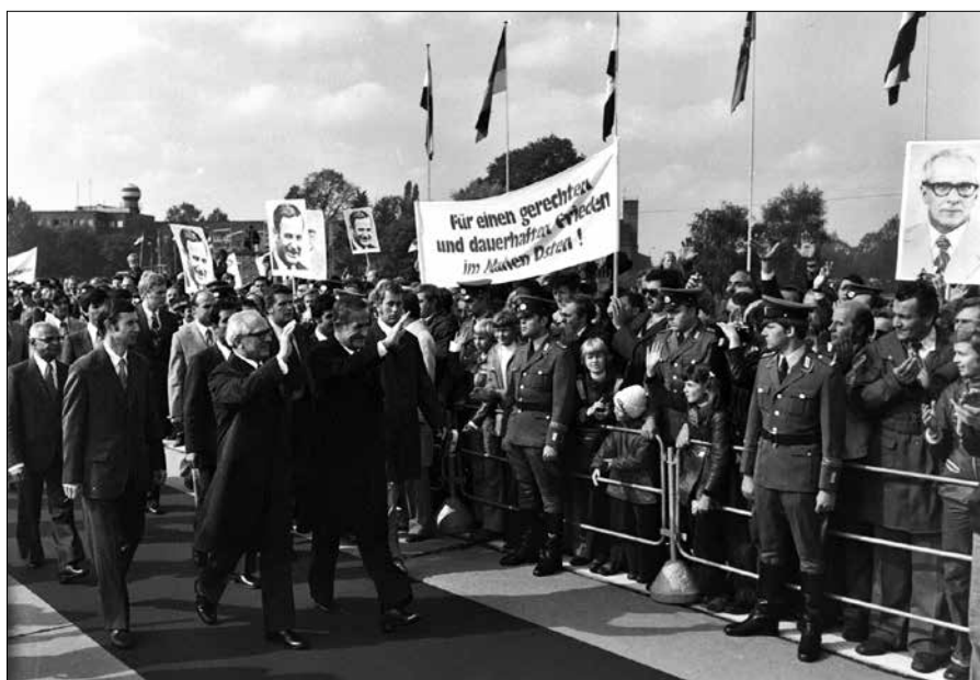
Strážní pluk „Felix Dzeržinskij“ v „akci“: přivítání syrského prezidenta Háfize al-Asada Erichem Honeckerem na letišti Berlin-Schönefeld v roce 1974

Dlouhohrající deska Ty, naše republika orchestru a pěveckého sboru strážního pluku „Felix Dzeržinskij“ Ministerstva státní bezpečnosti NDR (Stasi) z roku 1979