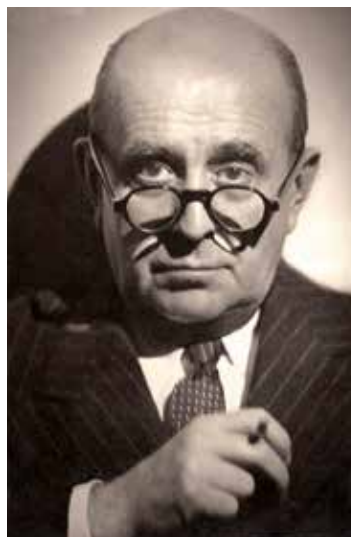
Foto: Jan Masaryk v roce 1947

Masarykova nezřetelná pozice mezi demokratickými politickými stranami, komunisty a prezidentem Benešem a možná i jeho snaha neučinit příliš riskantní krok pravděpodobně zapříčinily jeho neúčast na demisi ministrů nekomunistických demokratických stran (zprvu ještě s výjimkou sociálně demokratické strany) dne 20. února 1948. O tomto záměru zřejmě nebyl ani předem – snad nedopatřením – informován. V době únorové politické krize tak zůstal stranou, a dokonce opakovaně vyjádřil svůj záměr „jít s lidem“, což se za daných okolností dalo vykládat jedině jako podpora komunistů. Jejich vůdce Klement Gottwald ji ze strany populárního Jana Masaryka jistě uvítal a 25. února 1948 mu nabídl opět funkci ministra zahraničních věcí ve své doplněné vládě. Dne 10. března, v den, kdy se měla vláda v Národním shromáždění představit, však Jan Masaryk na nádvoří Černínského paláce v Praze, sídle ministerstva zahraničních věcí, zemřel za dodnes nevyjasněných okolností.