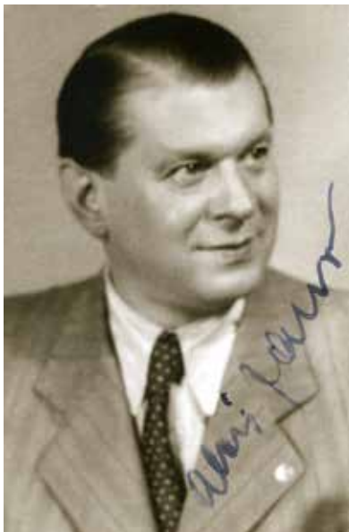
Alois Jaroš v roce 1946