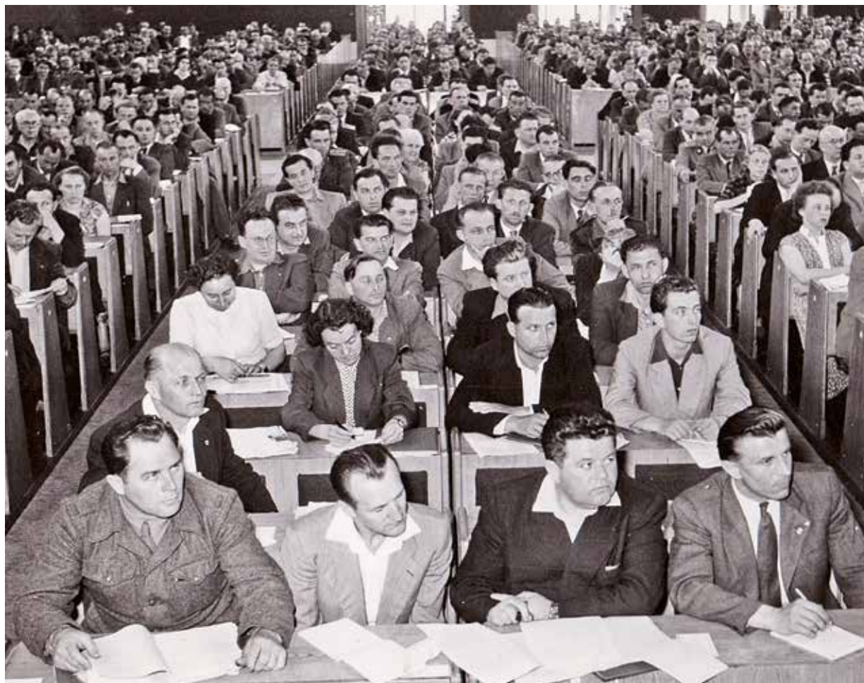
Funkcionáři KV KSČ v Praze a KV KSČ v Ostravě na II. celostátní konferenci KSČ