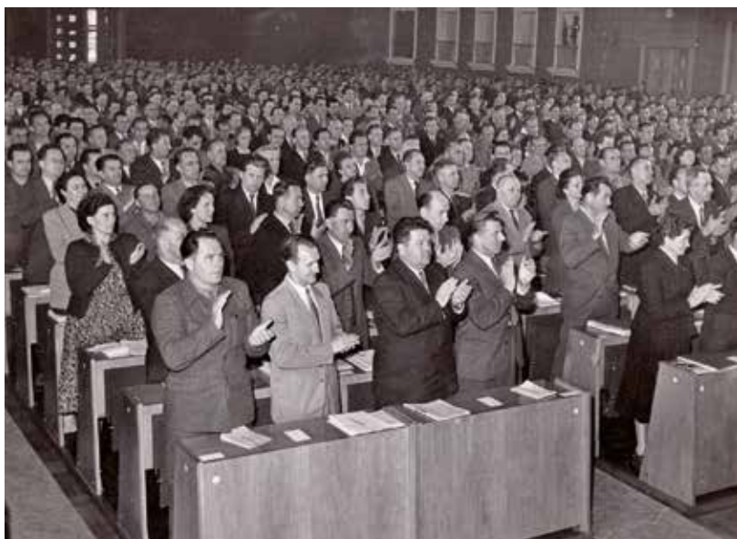
Celostátní konference funkcionářů KSČ