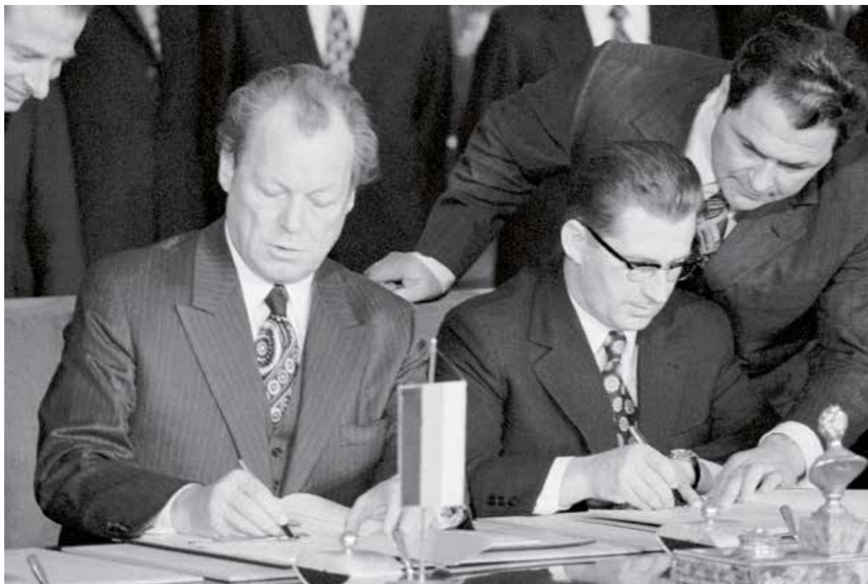
Willy Brandt a Lubomír Štrougal podepisují smlouvu mezi ČSSR a SRN na Pražském hradě