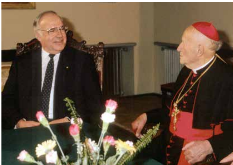
Pro komunisty trpěná záležitost, pro německého kancléře vrchol pražské návštěvy: debata s kardinálem Tomáškem

Kohl později napsal, že okamžiky strávené v rozhovoru s kardinálem pro něj byly osobním vrcholem ce-