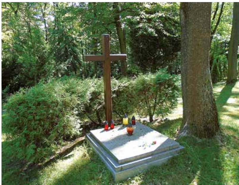
Hrob neznámých vojáků Wehrmachtu na hřbitově v Praze-Motole

Motolský hřbitov byl na poslední chvíli z kancléřova dopoledního programu vyškrtnut. Proč se tak stalo, není z dokumentů ani vzpomínek pamětníků jasné. Přesto se nabízí jedno celkem logické vysvětlení. Ko-