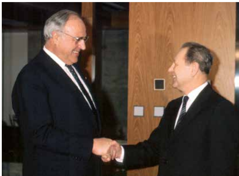
Setkání Helmuta Kohla s Milošem Jakešem v hotelu Praha