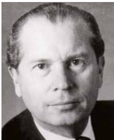
Werner Schattmann, velvyslanec Spolkové republiky Německo v ČSSR v letech 1985 až 1988

aniž by StB přinesl nějaké užitečné poznatky. 58