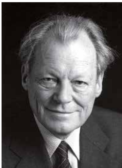
Willy Brandt v roce 1980