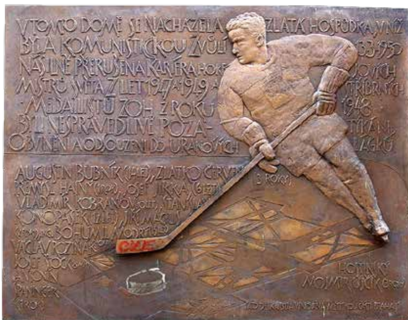
Pamětní deska na bývalé hospodě U Herclíků