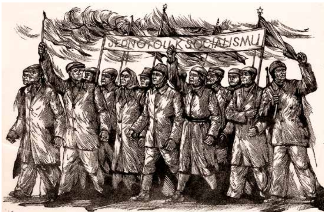
Ilustrace Lidová veselice a Únor 1948