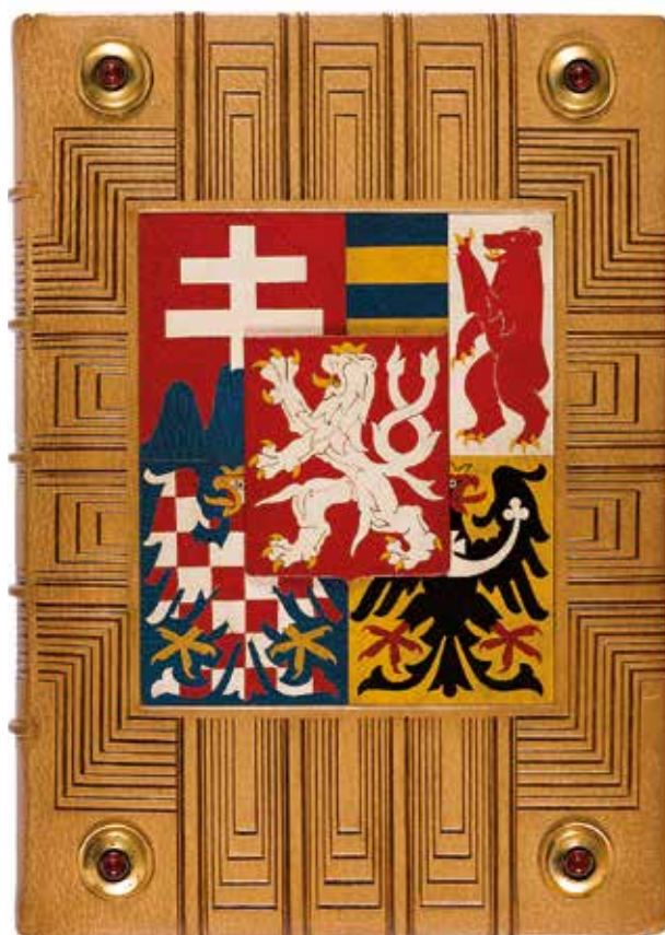
Vazba slavnostního provedení ústavy z roku 1920 a vazba Ústavy 9. května