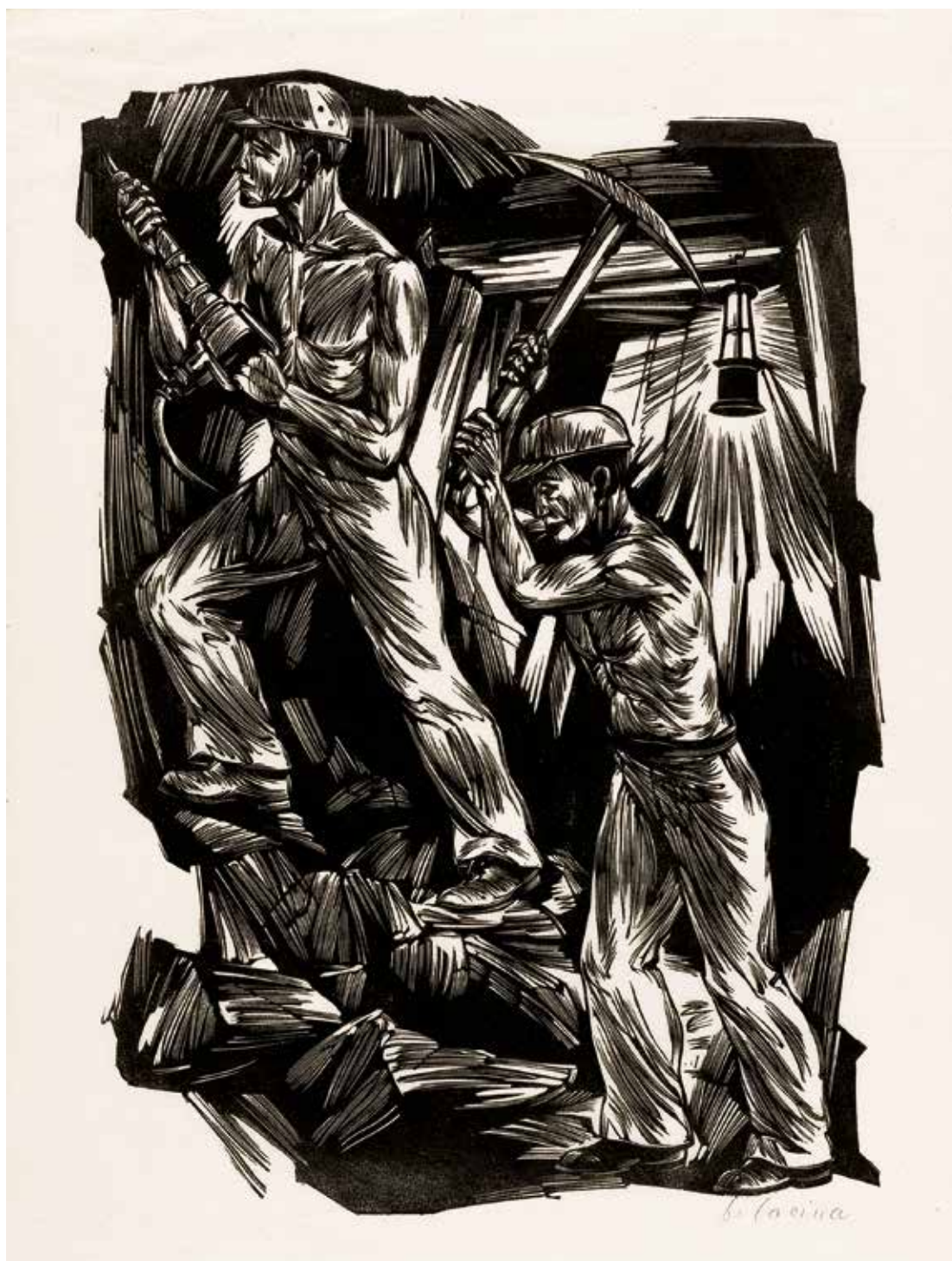
Návrh ilustrace Bohdana Laciny s názvem Hornictví