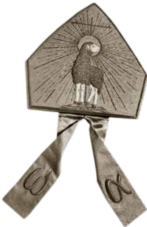
Mitra, ve které kardinál Meisner tajně světil kněze z Československa