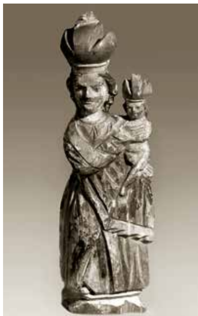
Soška svatohorské Madony. Svědkyně tajných svěcení v Berlíně.