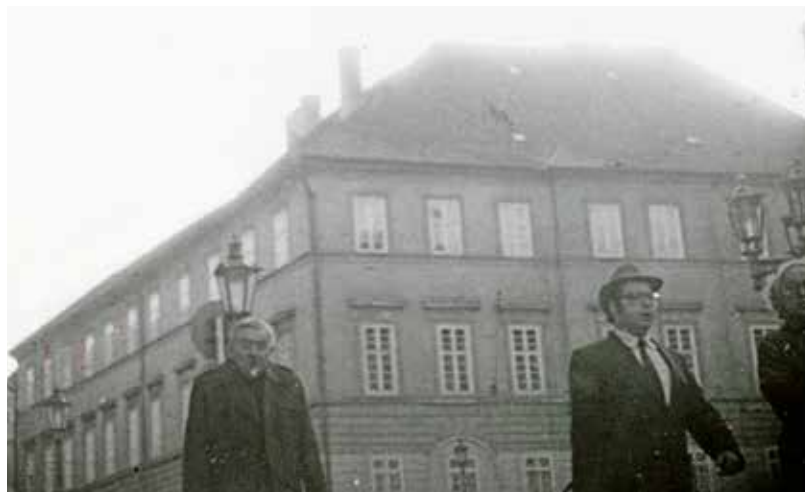
Fotografie ze sledování účastníků akcí Rady ŽNO v ČSR v Praze pořízená v rámci akce „Jan - A“

a řada operací byla na konci osmdesátých let ukončována. Výrazně se to dotklo tzv. svazků prověřovaných osob; jestliže v roce 1983 šetřila X. správa SNB „po linii sionismu“ 128 osob, 35 v roce 1988 klesl tento počet na 84. V polovině roku 1988 disponovala kontrarozvědná centrála v židovském prostředí celkem 34 tajnými spolupracovníky (TS), 1 důvěrníkem (D) a měla 11 kandidátů tajné spolupráce (KTS). 36 Stěžejní dlouhodobé operace vedené v rámci objektového svazku „Krajané“ („Rada“, „Archiv“, „Kongres“, „Generace“, „Rezident“, „Joint“, „Vřídlo“, „Splendid“ a „Alexandria“) i nadále pokračovaly. 37 Dokladem toho je i fakt, že po schůzce