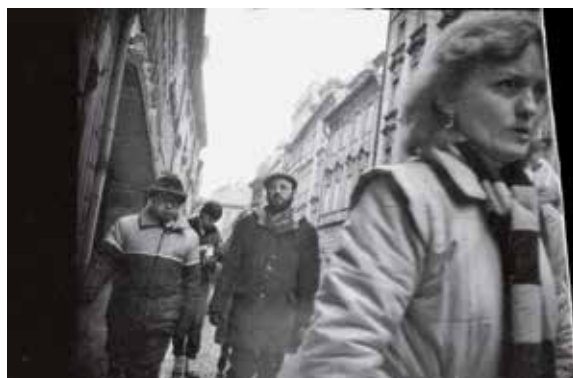
Fotografie ze sledování účastníků akcí pořádaných v rámci pražské židovské náboženské obce