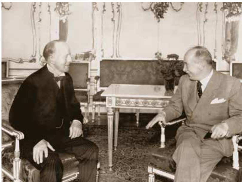
S lordem Runcimanem jednal také prezident Edvard Beneš