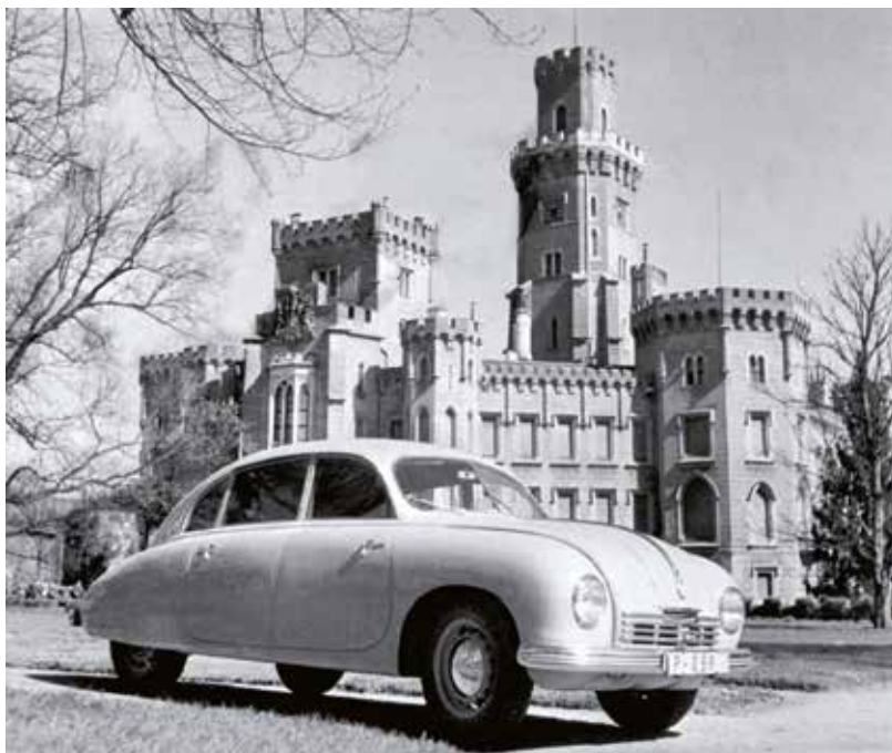
Zámek Hluboká v roce 1949