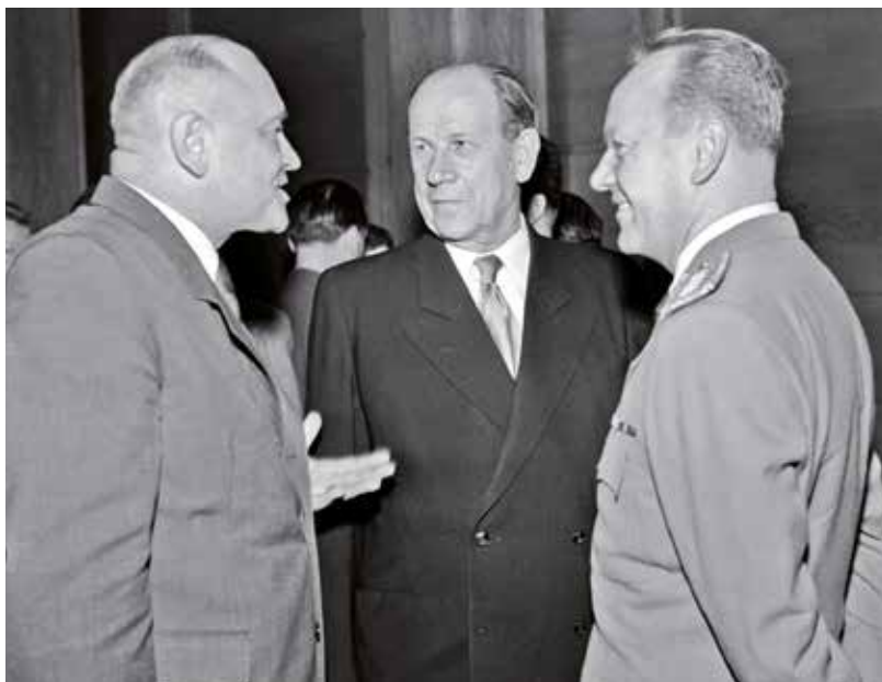
Alois Neumann již jako ministr pošt s prezidentem Antonínem Zápotockým a ministrem národní obrany Alexejem Čepičkou

Po skončení řeči poslance Neumanna byla zahájena rozprava. Jako první hovořila poslankyně za národní socialisty Milada Horáková. Ta v úvodu navázala na své předřečníky zdůrazněním výjimečnosti převáděného majetkového komplexu. Dále uvedla, že dosavadní „soukromokapitalistická povaha majetku“ neumožňovala jeho plné využití na poli „lidovými“ a sociálním. Zároveň podtrhla význam zaměstnaneckého aparátu s tím, že vtiskl panství český ráz. Podobně jako její kolegové hovořila o významu majetku a jeho možném využití při zakládání různých ozdraven a léčeben, ať by poskytoval důležitý zdroj příjmů nebo přímo budovy a parky vhodné k tomuto účelu. Věnovala se i otázce udržování a provozu historických památek obnásajících nemalé finanční náklady. Dotkla se