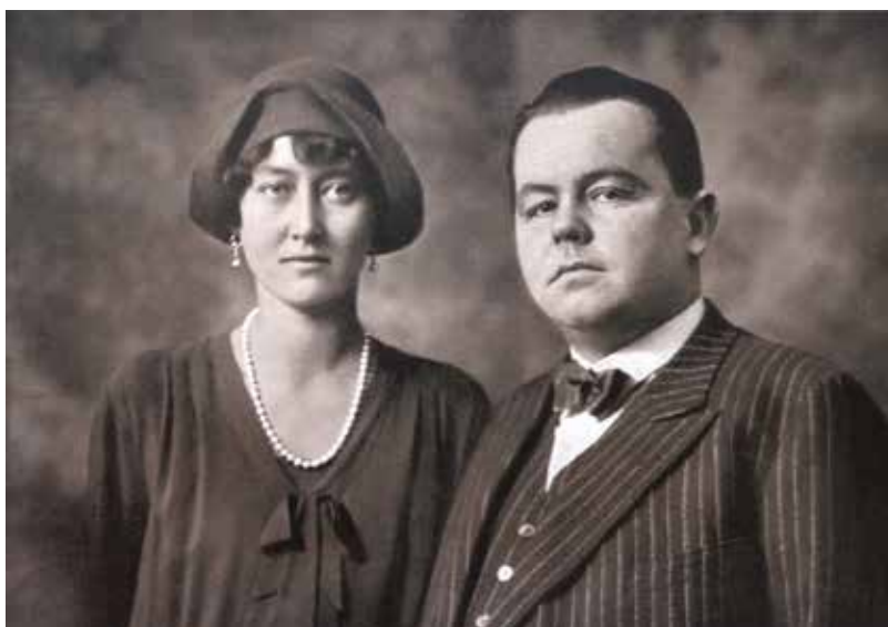
Princ František Schwarzenberg (vlevo) a poslední Schwarzenberg na Hluboké Adolf se svojí ženou Hildou. O veškerý majetek nacházející se na území Československa přišel na základě Lex Schwarzenberg.