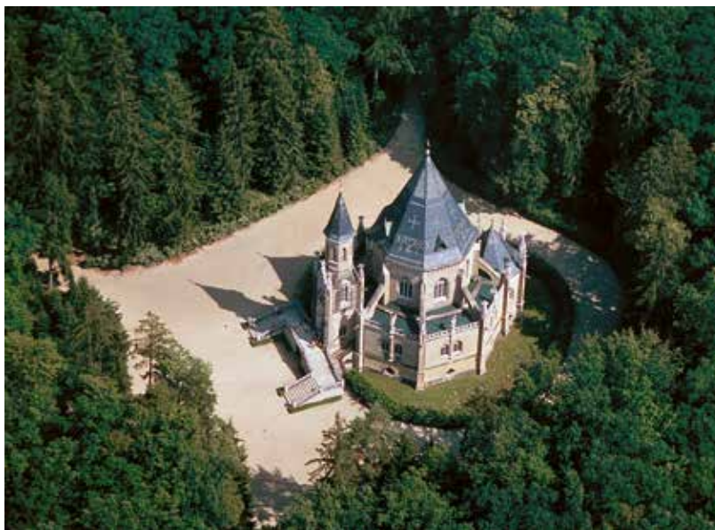
Hrobka rodu Schwarzenbergů v Domaníně u Třeboně