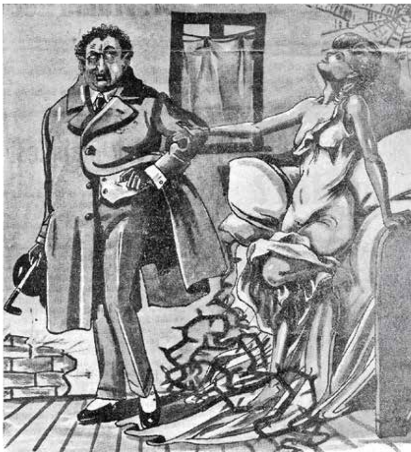
Fascinace násilím a sexem je pro antisemitismus typická. Štít národa téma s oblibou pojednával slovem i obrazem. Karikatura od Jana Tully.

Na počátku roku 1940 opustil po zmíněném sporu redakci karikaturista Jan Tulla, do té doby autor mnoha štvavých protižidovských textů. Nahradil ho kreslíř, který neměl evi-