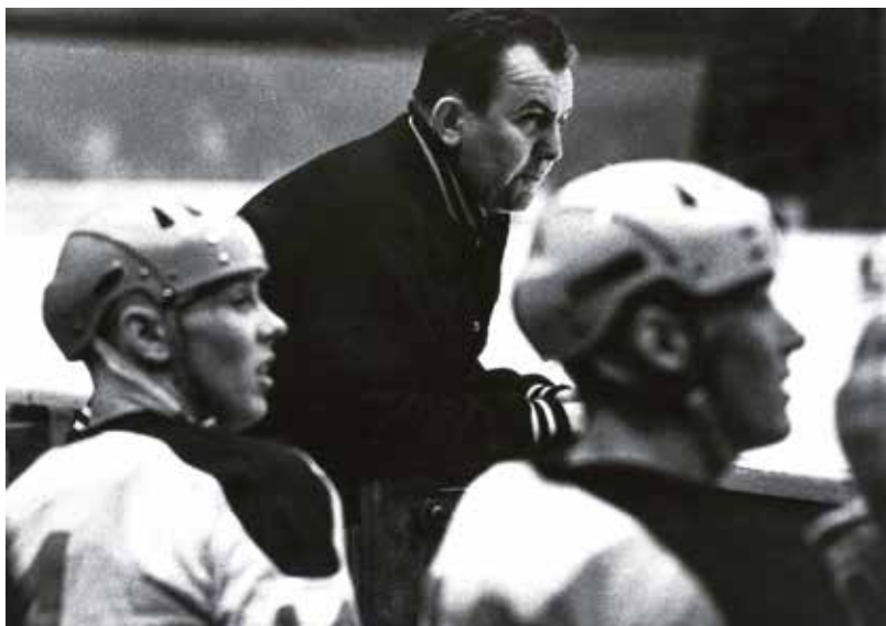
Jako trenér finského národního týmu ve Vídni v roce 1967

Měl jsem možnost se s ním opakovaně setkat. Vybavuji si několik