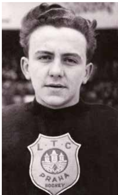
V dresu hokejového klubu LTC, 1948