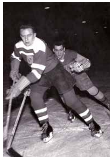
Úspěšný reprezentant, 1949