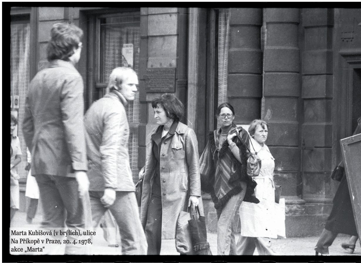
Marta Kubišová (v brýlích), ulice Na Příkopě v Praze, 20. 4. 1978, akce „Marta“