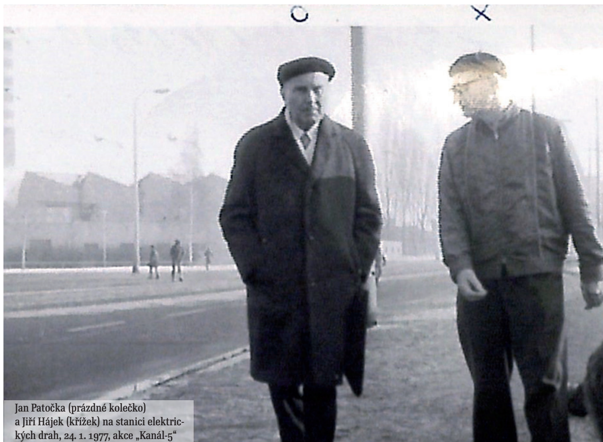
Jan Patočka (prázdné kolečko) a Jiří Hájek (křížek) na stanici elektrických drah, 24. 1. 1977, akce „Kanál-5“