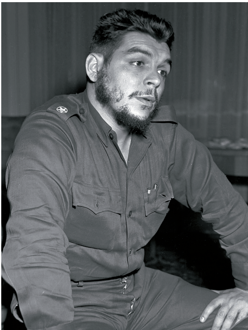
Che Guevara v roce 1960

Guevara měl tehdy několik vazeb k Československu. Na Kubě poznal v rámci poskytované pomoci pár výrazných československých poradců a naši zemi opakovaně oficiálně i tajně navštívil. Největší pozornost vzbudila jeho utajovaná cesta v roce 1966, odhalená o desítky let později. Dlouho kolem ní přetrvávalo mnoho nejasností a do jisté míry tomu tak je dosud. Přesto lze základní rámeček tohoto pobytu, ale i dalších podobných cest objasnit. Klíčem k tomu jsou především archivní materiály bývalé I. správy SNB. Jedná se nejen o svazky operativní korespondence rozvědky nebo o svazek konspiračního bytu (KB) s krycím jménem „Venkov“. 1 Obraz života v domě a „galerii jeho návštěvníků“ je možno vytvořit i pomocí vyhledávání v registrech svazků na webu ABS. Propojení této databá-