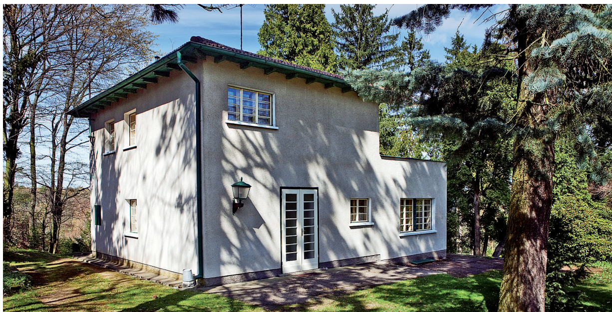
Dobře ukrytý dům v Ládvi, stav z roku 2009