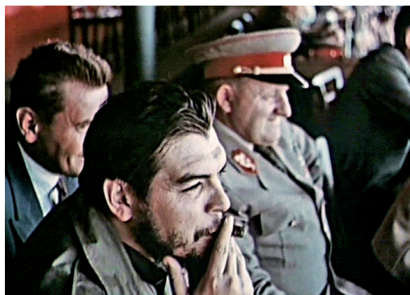
Záběry z návštěvy Ernesta Guevary v 60. letech v Československu, na obou snímcích s ministrem národní obrany Bohumírem Lomským