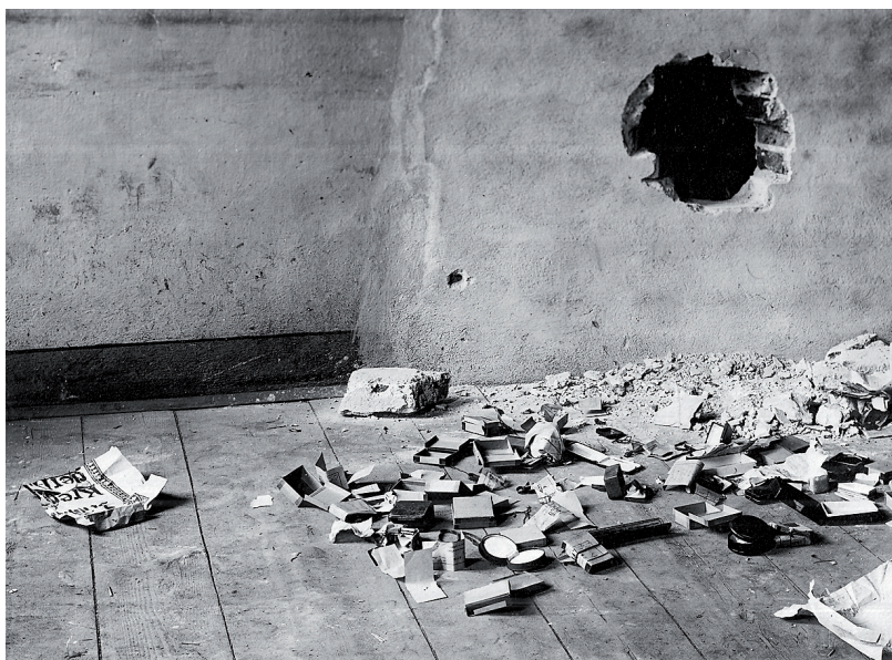
Pancéřová pokladna vyloupená Emanuelem Karlíkem a místnost s pokladnou, do níž se kasař proboural