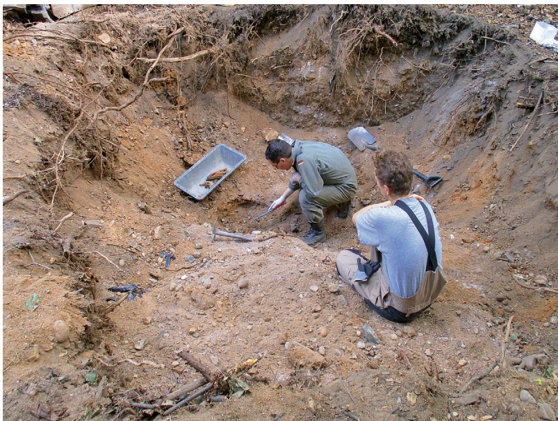
Odkrývání hromadného hrobu v Roztockém háji 15. září 2015

První vojáci průzkumných jednotek Rudé armády vstoupili do města vpoledne 9. května 1945. Ještě během povstání bylo do Roztok převezeno několik stovek německých zajatců z ohrožených částí Prahy – dne 8. května 1945 se v Roztokách nacházelo celkem 544 německých válečných zajatců a okolo pěti set internovaných civilistů. To přinášelo pro třítisícové město řadu především logistických problémů. Až na ojedinělé případy však bylo jednání civilních obyvatel i příslušníků PV vůči zajatcům a internovaným korektní a nedocházelo k případům ohrožení na životech.