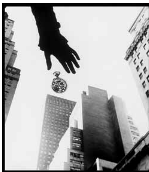
Stíny nad městem, 1964 Mondrian, 1962 Světové obchodní centrum, 1971 Kdyby tisíc klarinetů, 1963 Washingtonova ruka, 1964