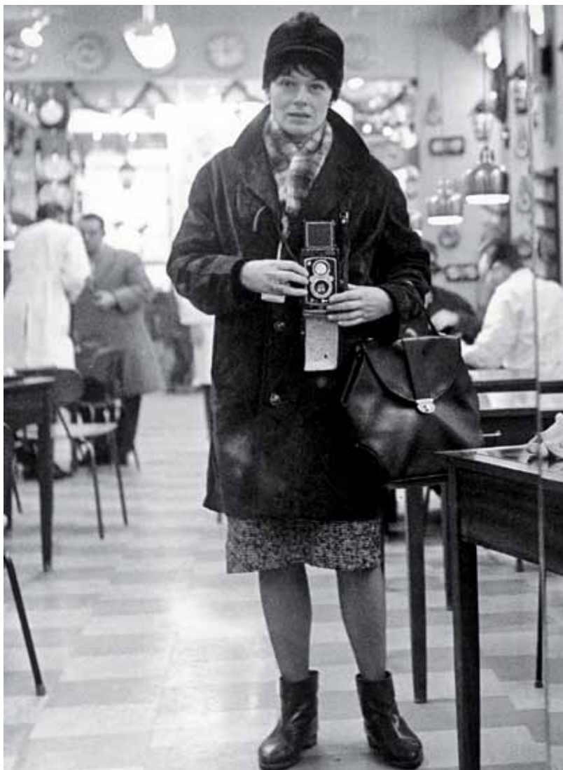
Autoportrét v dánském bistro, 1960