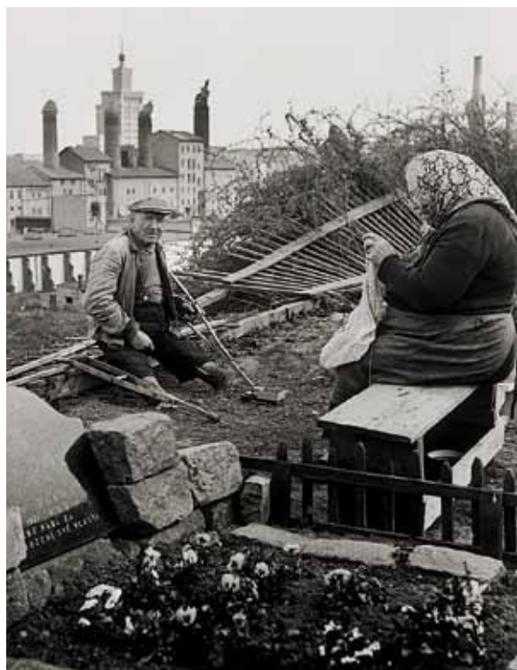
Nedělní odpoledne, 1955