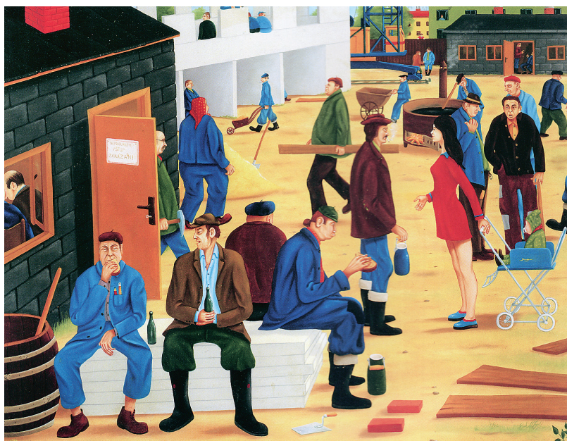
Na brigádě, 1972–73, olej na plátně – proletářský ideál: pracovat jako za socialismu a mít se jako na Západě

Problém s tímto Pullmannovým tvrzením je ovšem v tom, že si ono pohádkové binární vyprávění o boji prince se saní vymyslel. Ačkoliv jinde cituje prameny přesně, zde pouze všeobecně tvrdí, že výkladově nejproblematičtější jsou v tomto ohledu texty z okruhu Ústavu pro studium totalitních režimů (s. 15,