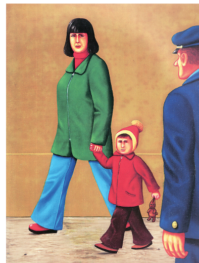
Matka, 1976, olej na plátně – matka v socialistickém Československu 1976 nebo matka v nacionálně socialistickém Německu 1936: jak se lišila kritéria, podle nichž se utvářel jejich hodnotový a hodnotící rámec a vztah k režimu?