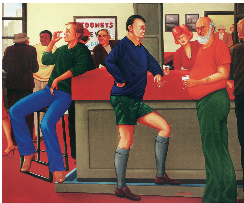
Hospoda v Sydney, 1982, olej na sololitu – v čem se v roce 1982 lišila společnost „kapitalistické“ Austrálie od společnosti „socialistického“ Československa či třeba od společnosti renesanční Itálie?

Pullmann opět celou věc přehrává na jakýsi celospolečenský diskurs o socialismu, který si ovšem od A do Zet vymyslel. Otevřená diskuse ve vědeckých ústavech či na vysokých školách