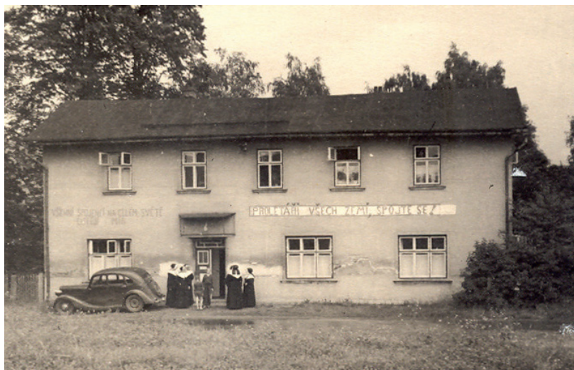
Ubytování sester v budově bývalé restaurace v Nových Voletínách u Trutnova