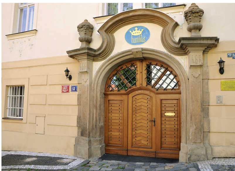
Vchod do Domu sv. Notburgy ve Šporkově ulici v Praze. Nad portálem je heslo boromejek Humilitas, které značí mírnost, pokoru, nesobeckost, laskavost a soucit.

Také v příhraničních továrnách byly boromejky nuceny účastnit se různých schůzí a politických školení a zřejmě jim občas i vyhrožovali: Jeden týden jsme si i do práce nosily s sebou v tašce nepotřebnější věci, protože nám vyhrožovali, že nás odvezou na Sibiř. 42 Podle stávajících opatření se na řeholnice mělo působit také prostřednictvím tisku, který měl být na pracovišti