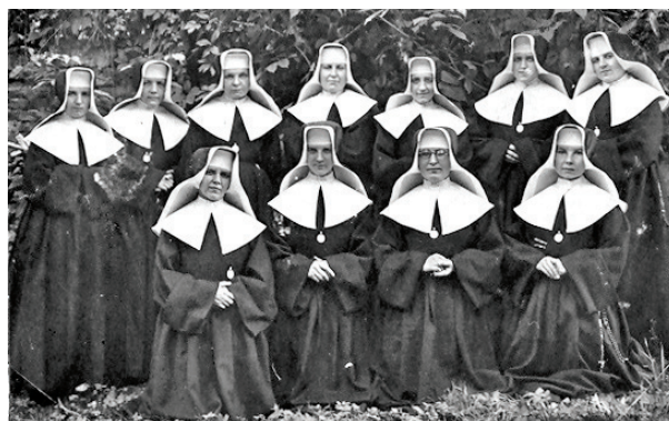
Boromejky ošetřující nemocné vojáky v tachovském lazaretu. Na snímku vpravo učitelský sbor z pražské Malé Strany, první polovina 40. let.