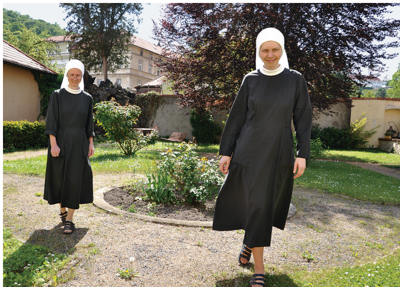
Boromejky na zahradě Domu sv. Notburgy, 2011