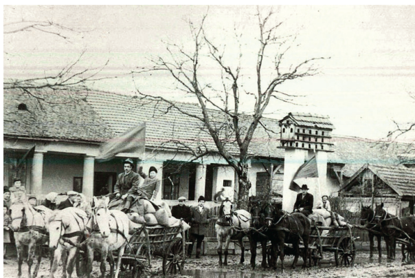
Družstevníci z župy Bihor se 7. listopadu 1952 vracejí domů s polními plodinami po rozdělení výnosu z jejich práce. Vpravo: Porada úderníků