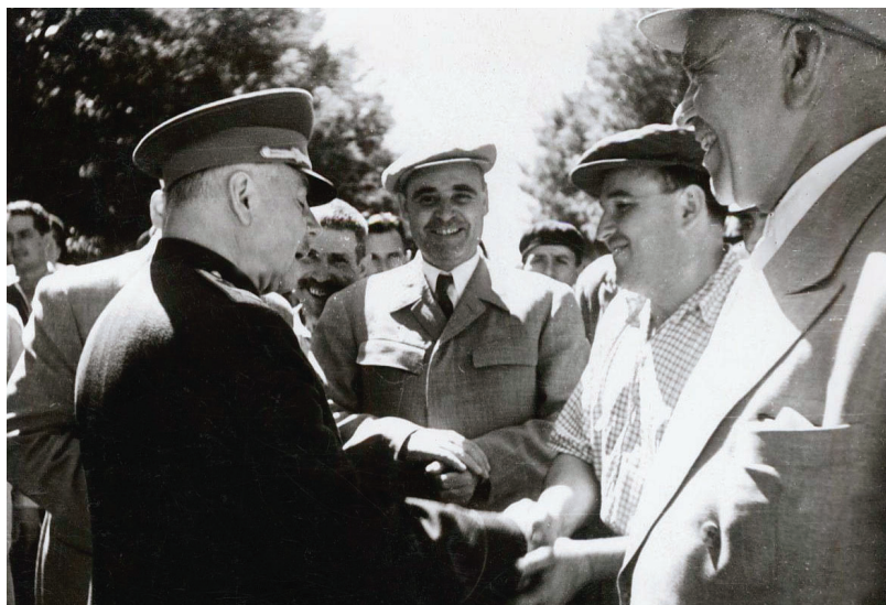
Generální tajemník Rumunské dělnické strany Gheorghe Gheorghiu-Dej v roce 1951. Vpravo: Gheorghe Gheorghiu-Dej si podává ruku s družstevníky při návštěvě JZD Leninova cesta v obci Liveștii de Jos v okresu Bukurešť, 1951.

A dále: Až do roku 1945 neměli Češi a Slováci v dějinách tak vážné problémy s Ruskem (později se Sovětským svazem) jako Rumuni. Navíc se Rudá armáda nechovala při svém průchodu Československem v letech 1944 a 1945 jako na obsazeném území. Vandalismus, loupeže a další podobné „tradiční“ činy Rudé armády nedosáhly na československém území zdaleka takových rozměrů jako v Rumunsku nebo Maďarsku, které byly za druhé světové války spojenci Německa. Z tohoto důvodu byl postoj Čechů a Slováků k SSSR a komunismu na konci války vstřícnější než postoj Rumunů.