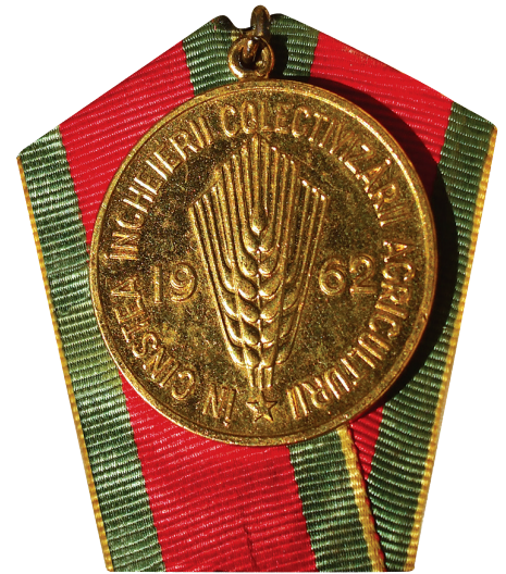
Medaile Na počest dokončení kolektivizace, která se roku 1962 udělovala předsedům vybraných JZD

Od začátku 80. let se systematizace stala neoddelitelnou součástí ročních i pětiletých plánů. Číslo zveřejněná v březnu a červnu 1988 19 ukazovala, že mělo zmizet 900 obcí z celkového počtu 2705 a že se počet vesnic měl snížit z 13 123 na maximálně 5000 až 6000. Tímto způsobem mělo 7000 až 8000 vesnic zmizet z mapy Rumunska a ty, které by zůstaly, měly být zdemolovány a z 50 až 55 procent přebudovány. 20