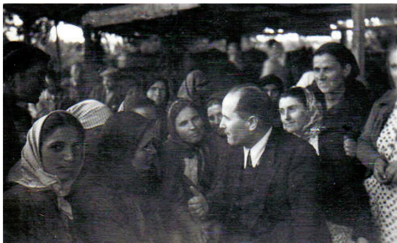
Straníček líčí rolníkům výhody kolektivizace