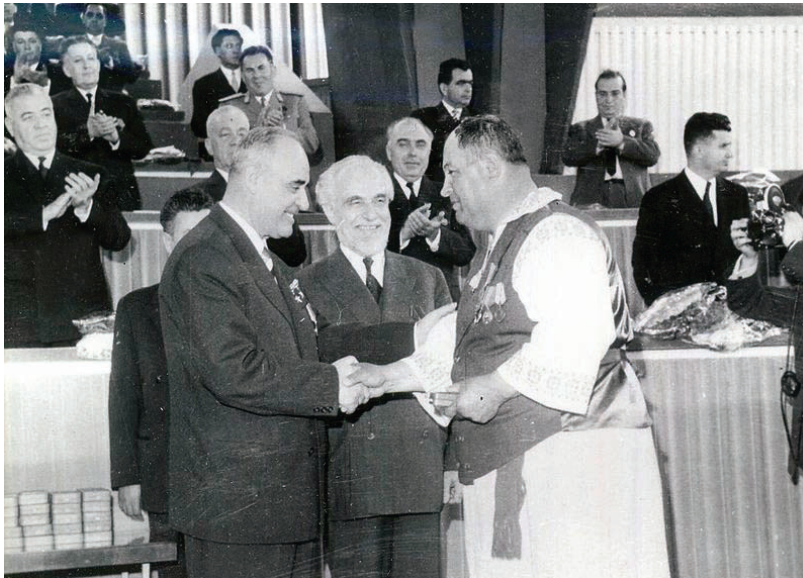
Tajemník Štefan Voitec a generální tajemník ústředního výboru Rumunské dělnické strany Gheorghe Gheorghiu-Dej udělují medaile u příležitosti dokončení kolektivizace zemědělství v Rumunsku, březen 1962