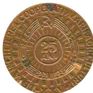
Pamětní mince vydaná u příležitosti 25. výročí dokončení kolektivizace zemědělství v Rumunsku