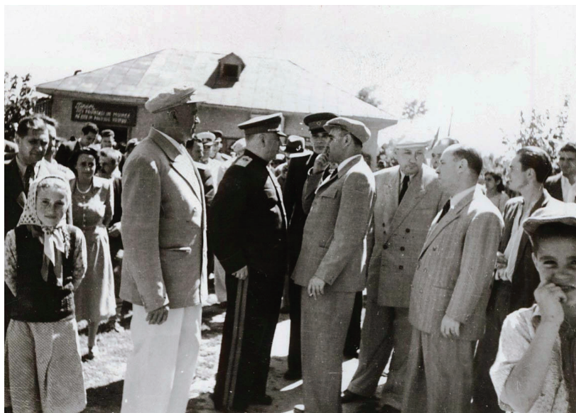
Generální tajemník Rumunské dělnické strany Gheorghe Gheorghiu-Dej, přední straníci Petru Groza, Teohari Georgescu a Leonte Răutu a sovětský maršál Kliment Efremovič Vorošilov na návštěvě JZD Leninova cesta, 1951

druhé polovině 80. let. Zatímco v Československu, stejně jako v celém socialistickém bloku, vál vítr změny a demokratizace, zatímco bylo jasné, že pod vlivem Gorbačovovy perestrojky 15 se komunismus a vše s ním spojené (včetně kolektivního zemědělství) otřásá v základech, Ceaușescu pokládal za vhodné „zpečetit definitivní vítězství“ komunistického zřízení v Rumunsku dvěma absurdními a dramatickými činy: rozšířením kolektivizace do kopcovitých a horských oblastí a tzv. systematizací rumunských vesnic.