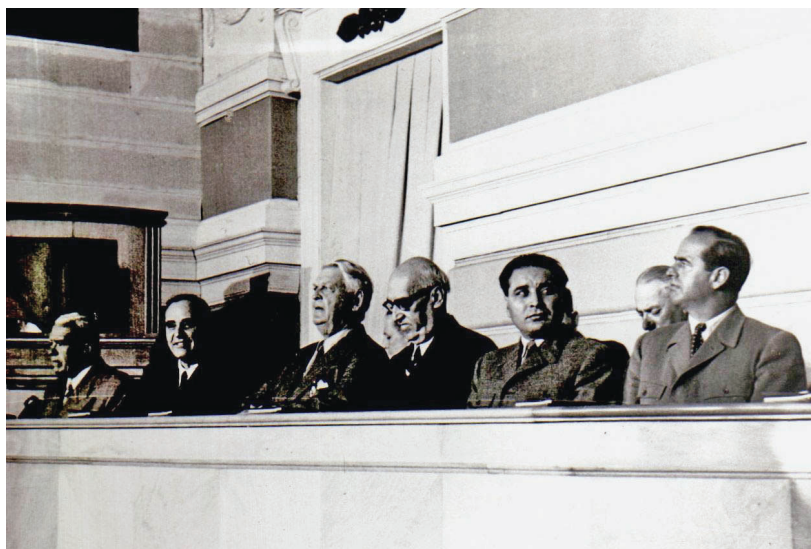
Přední straník Petru Groza, spisovatel Mihail Sadoveanu, přírodovědec Traian Săvulescu a další osobnosti na prvním sjezdu úderníků z Jednotných zemědělských družstev, který se konal v Sjezdovém sále na Magherově třídě v Bukurešti mezi 21. a 23. květnem 1953