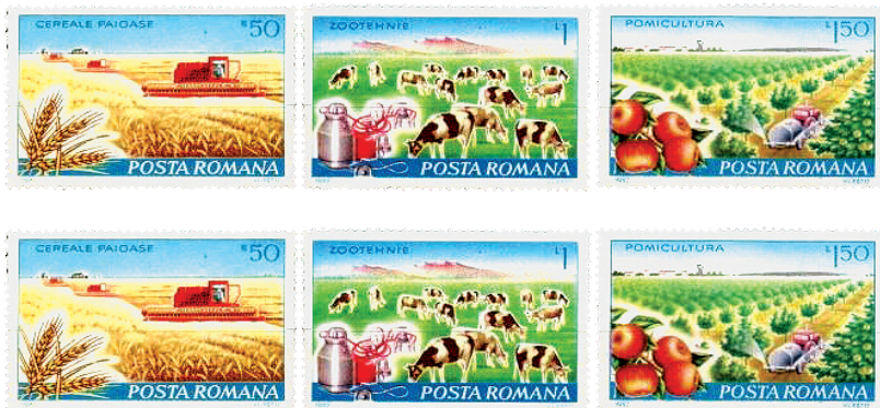
Série poštovních známek věnovaná dokončení kolektivizace zemědělství v Rumunsku

neokomunisty z Fronty národní záchrany (Frontul Salvării Naționale – FSN) právě díky hlasům venkovského obyvatelstva, které se obávalo změn a odmítalo je. Připadá vám to povědomé? Rumunský venkov měl v roce 1946 obavy ze změn, i tehdy je odmítl. Ale argument síly, podpořený přítomností Rudé armády v zemi, byl tehdy mnohem pádnější a rumunský venkov zaplatil za svou odvahu a opovázlivost slzami a krví.