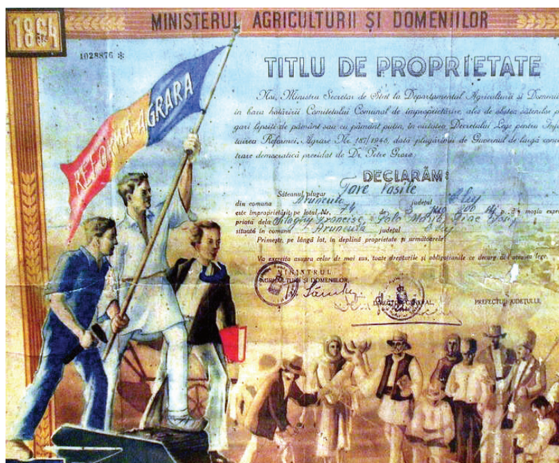
Doklad o vlastnickém právu, vydaný na základě pozemkové reformy

V Rumunsku se jak velkostatkáři a sedláci, tak střední a malí rolníci, ba dokonce bezzemci od samého začátku vzpouzeli socialismu a myšlence kolektivizace. Ani pozemková reforma z roku 1946, uskutečněná první rumunskou vládou s komunistickou účastí v poválečném období, 1 jejímž pravým cílem bylo zvýšit oblíbenost a popularitu Rumunské dělnické strany (Partidul Muncitoresc Român – PMR) ve venkovském prostředí, vlastně nepřinesla zásadnější změnu tohoto stavu: PMR se povedlo naklonit si pouze malou část bezzemců, ale i ti